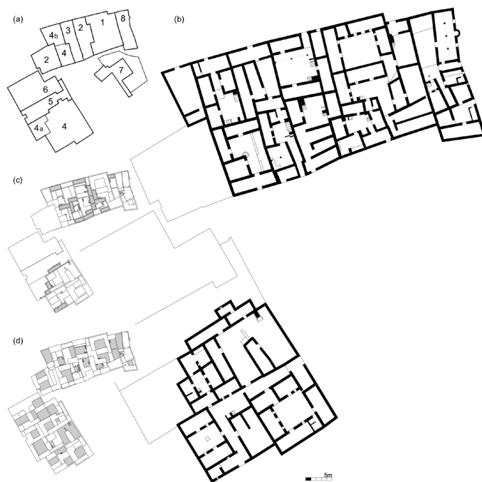
Fig. 4 Planta de conjunto de Tagnit n'Abdiy: a estrutura predial, 1-7 diferentes habitações 8 oratório (vestíbulo, pátio, cisterna, abluções, sala de oração, espaços domésticos) b piso térreo c compartimentos do piso superior d pátios, currais e espaços descobertos

A transformação destes conjuntos edificados tende a privilegiar, com o avançar do século passado, o desenho mais regular e menos circunstancial de novos módulos justapostos aos conjuntos edificados preexistentes. Esta tendência é especialmente evidente no pátio dos hóspedes, de planta quadrangular, que aspira, por vezes, a constituir uma quase habitação autónoma