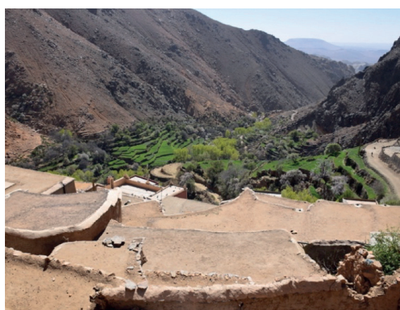
Fig. 6 Diversidade do povoamento e da arquitetura no Anti-Atlas: a celeiro coletivo de Issouka Iberkak a poente de Tagnit n'Abdiy b Ksar Tissergate no vale do Draa c aldeia de Oumesnat na região ocidental d aldeia de Tizgui, Jbel Siroua

através do preenchimento de espaços intersticiais e da expansão para norte e poente (no caso do bloco norte) e para sul e poente (no caso do bloco poente). A configuração global da aldeia é, assim, o resultado de um conjunto de intervenções que ocorre à escala local, relativa à transformação de cada uma das suas casas em ciclos sucessivos: num primeiro momento, comportando a ampliação da habitação associada à consolidação da família alargada (com um quarto para cada um dos filhos casados); e, num segundo momento, com a separação em diferentes casas resultando no eventual parcelamento da habitação original (como ocorreu com as habitações 4a e 4b, que antes integravam a fração 4). Em qualquer caso, este processo tende a perder relevância no presente, seja pela importância crescente do fenómeno da emigração, seja por uma valorização crescente da organização ditada pela família nuclear.