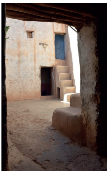
Fig. 5 Pátios da casa 1 de Tagnit n'Abdiy