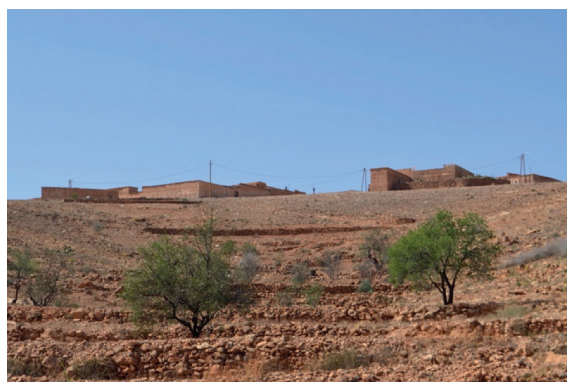
Fig. 3 Distintas expressões da paisagem: a cercas de Opuntias b tanque para abeberamento do gado c partida do rebanho e d socalcos nos talwegues pouco pronunciados