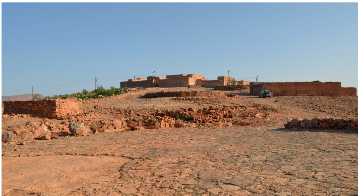
Fig. 1 Tagnit n'Abdiy vista de poente

mostrando o peso duma cultura territorial histórica. A gestão racional e coletiva dos recursos naturais presentes (água, solo, vegetação) baseia-se em conhecimentos, técnicas e processos de construção, pastorícia e cultivo tradicionais que, transmitidos de geração em geração, estão na origem do modelo de organização e (trans)formação da paisagem de Tagnit n'Abdiy. Para a sua identificação e caracterização contribuiu sobremaneira o trabalho de campo e a recolha de informação oral, considerados fundamentais para o mapeamento das estruturas hidro-agro-pecuárias e o registo das suas designações locais (fig. 2). A paisagem organiza-se em torno da povoação na qual convergem seis caminhos de terra batida integrados no sistema de vias no território e de ligação ao espaço circundante: conexão à principal via de comunicação e ao transporte público; à escola primária; às aldeias próximas; à cisterna pública localizada no vale; e, ainda, às terras de pastagem. A partir do centro correspondente ao núcleo residencial e religioso depreende-se um modelo concêntrico de três áreas fundamentais. A área mais próxima das habitações compreende pequenas cercas muradas (predominantemente para amendoeiras, mas também, embora residualmente, figueiras, ameixeiras e videiras em latada), entre as quais