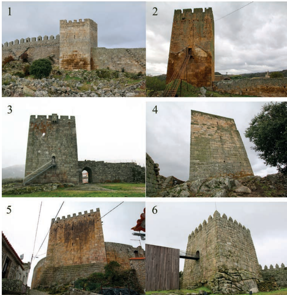
Figura 5 – Torres estudiadas: 1. Numão; 2. Longroiva; 3. Linhares da Beira; 4. Marialva; 5. Celorico da Beira; 6. Trancoso.