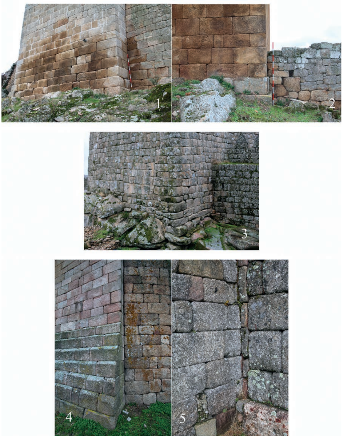
Figura 6 – Detalle de los adosamientos de los lienzos a las torres: 1. Numão; 2. Longroiva; 3. Trancoso; 4. Celorico da Beira; 5. Linhares da Beira.

espoliados, mientras que la fábrica de la segunda es de sillería. Por otro lado, los lienzos están apoyados, por lo que se ha generado una línea de adosamiento perfectamente definida (Fig. 6.2). Consecuentemente, las dos construcciones son de diferentes momentos, aunque entendemos que una torre independiente sería el origen de la fortificación. A priori, la cronología propuesta, soportada en una inscripción, es el año 1174, durante el reinado de Alfonso de Portugal, cuando Galdimus, maestre del Temple, junto con sus milites, habría erigido la torre (Barroca, 2000, doc. 148).