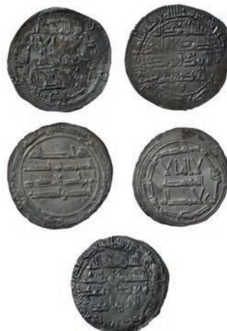
Figura 3 – Lote de dirhams recuperados del relleno de la torre de Idanha-a-Velha; fechados en 778, 839 y 843 d.C.