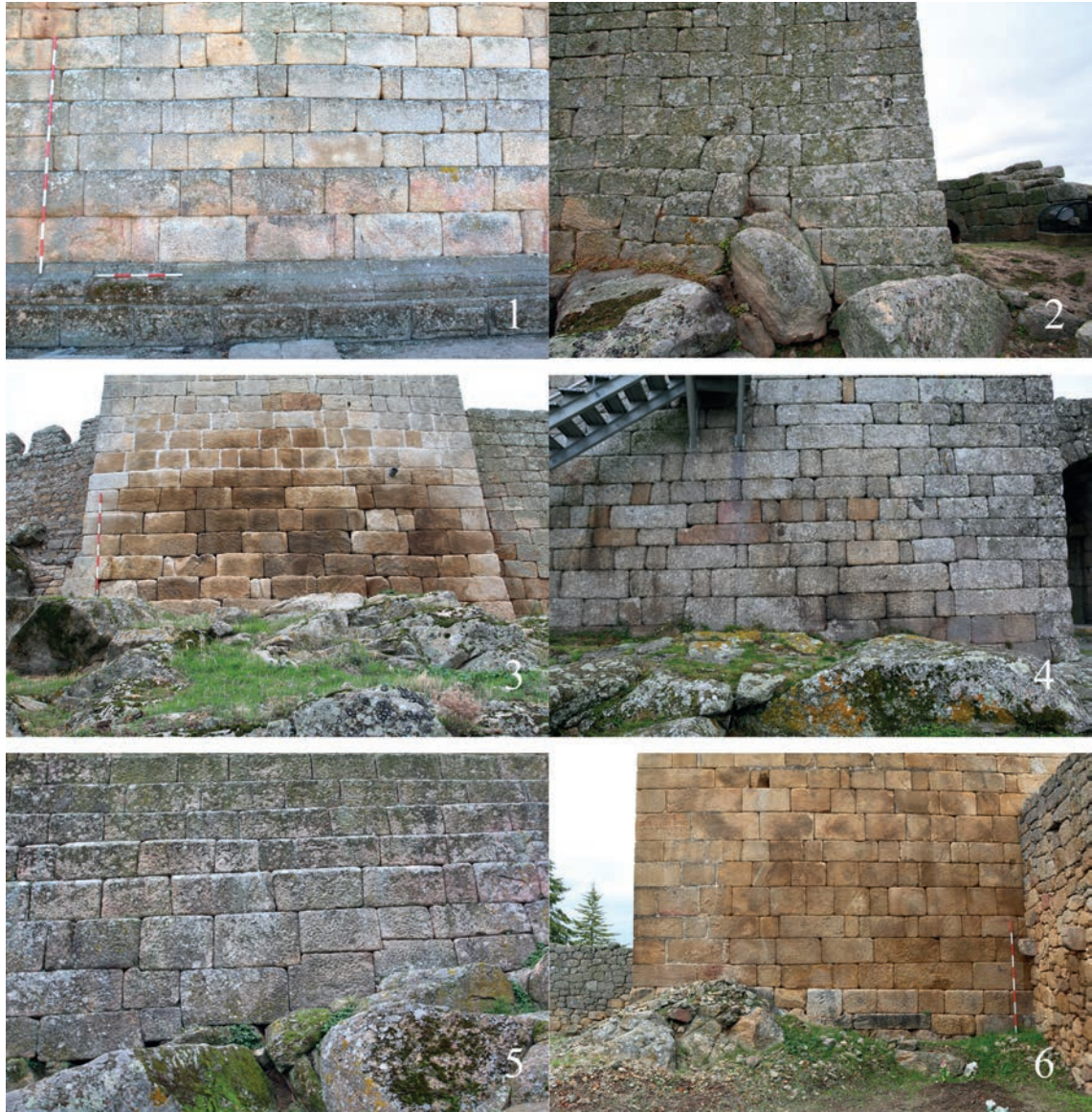
Figura 8 – Detalle con los paramentos isódomos a soga y tizón: 1. Idanha-a-Velha; 2. Marialva; 3. Numão; 4. Linhares da Beira; 5. Celorico da Beira; 6. Longroiva.

una primera conclusión: existe una intención o mandato para erigir numerosas torres, eligiendo lugares estratégicos para ello, una orden dada por un único poder y edificadas con el mismo estilo arquitectónico.