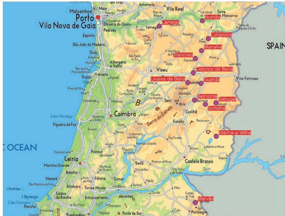
Figura 4 – Mapa de Portugal con la situación de las torres estudiadas.