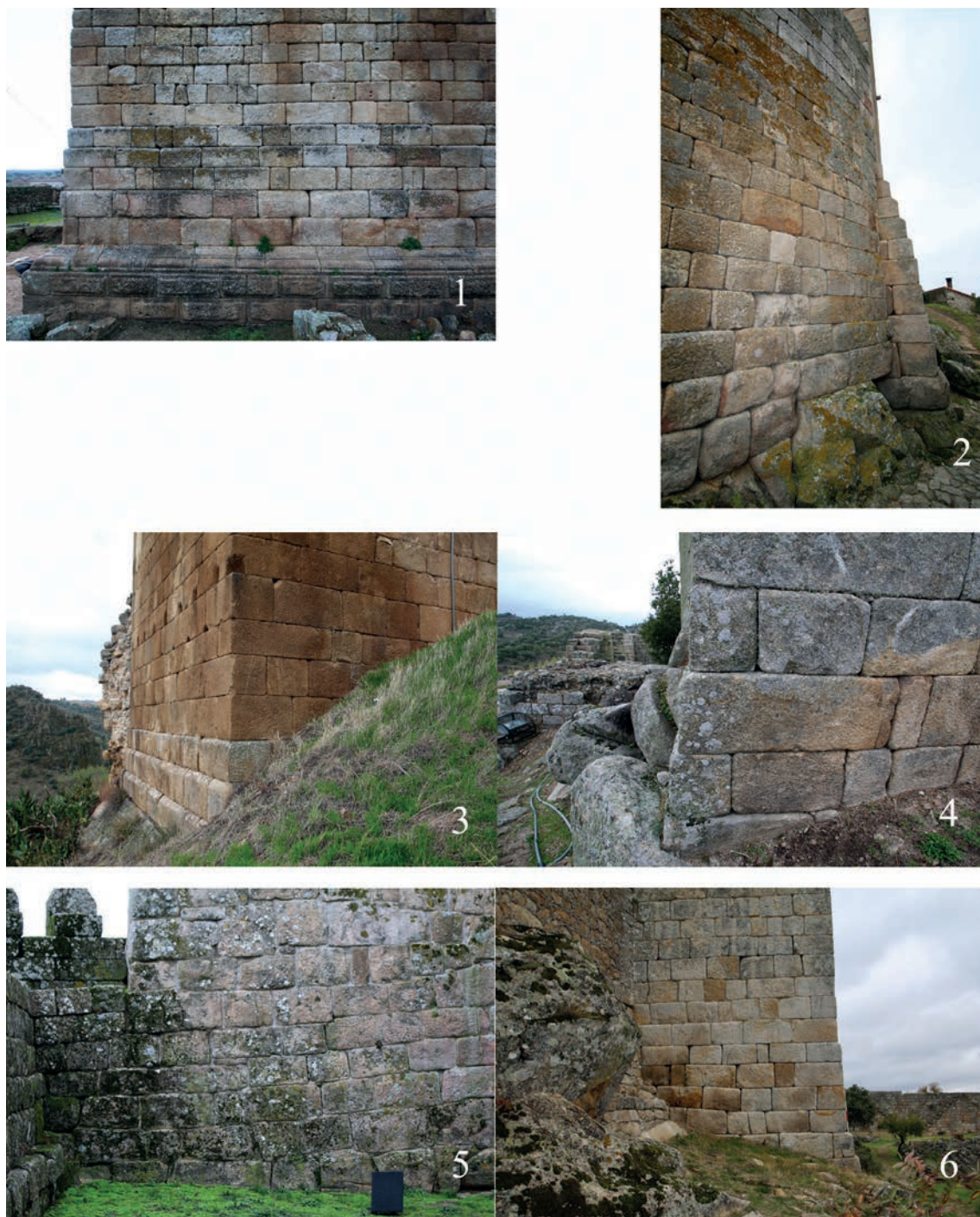
Figura 7 – Detalles de las zarpas escalonadas: 1. Idanha-a-Velha; 2. Celorico da Beira; 3. Longroiva; 4. Marialva; 5. Trancoso; 6. Numão.

políticos acaecidos con la actividad militar proyectada entre los siglos VIII al XI; y, finalmente, la realidad arquitectónica.