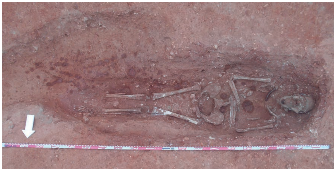
Figura 2 – Inumação primária completa (UE 512) identificada na Sepultura 13.

A maioria das inumações recuperadas estava incompleta devido a perturbações post-mortem de origem antrópica decorrentes da abertura de valas de saneamento e abastecimento de água, à colocação de postes de eletricidade e aos trabalhos de rebaixamento para o pavimento da estrada. Este rebaixamento do nível de circulação torna-se claro pela profundidade preservada dos enterramentos, que nalguns casos estavam a escassos 3 cm da base do asfalto. É possível que este grande rebaixamento resulte do desenvolvimento urbanístico das casas em redor da Igreja.