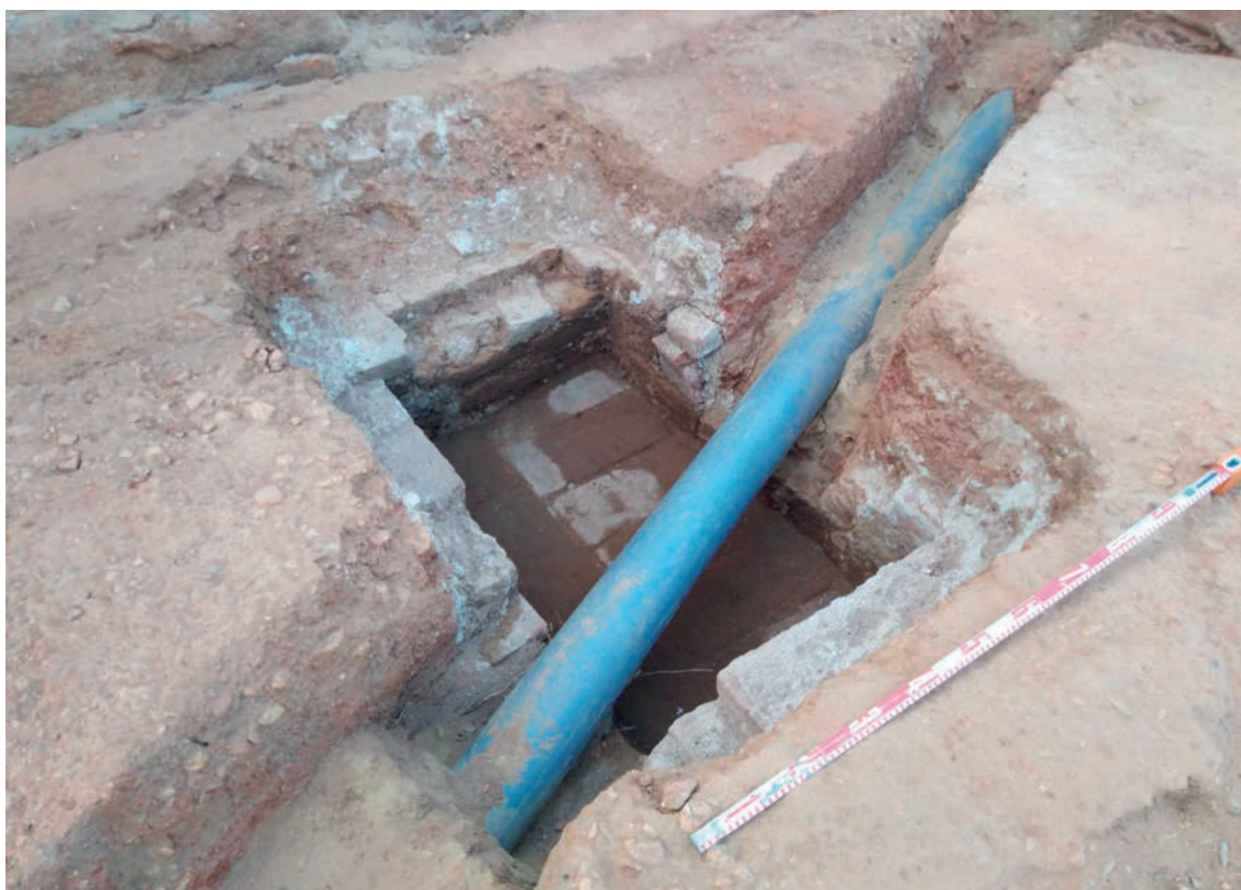
Figura 3 – Possível tanque de água identificado na área da necrópole.

Os depósitos do interior da estrutura apresentavam abundantes materiais arqueológicos do século XVI, com base num estudo preliminar (Baptista, 2012). Recolheu-se cerâmica comum, como uma asa de cântaro, faianças sem decoração, vidros verdes e melados, havendo deste último uma tigela completa. Para além destes recuperaram-se ainda vestígios de fauna e uma moeda não legível.