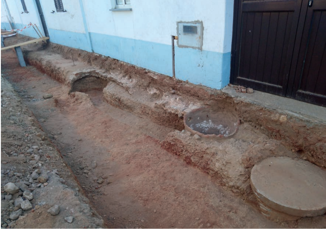
Figura 8 – Vista desde o sudeste do antigo lagar na Rua 25 de Abril.