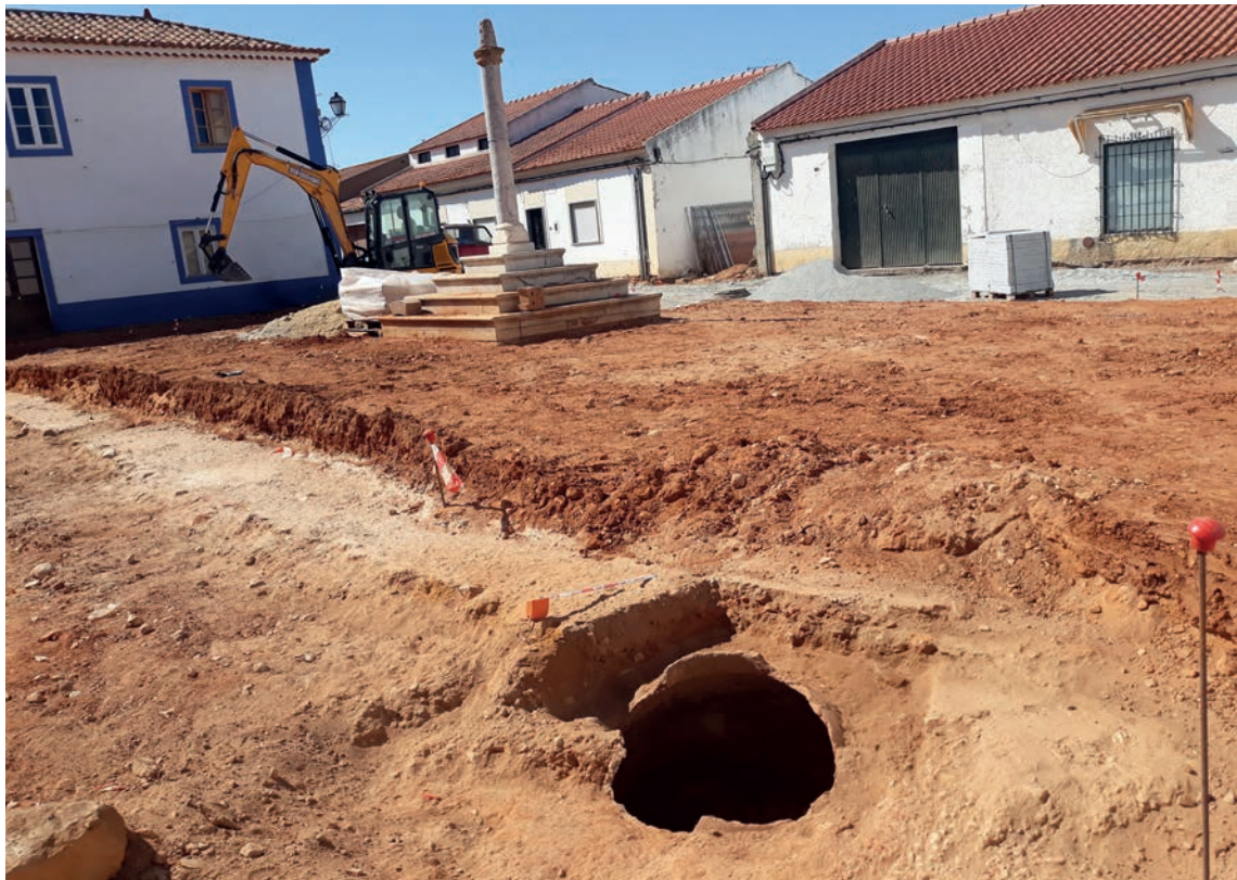
Figura 4 – Vista desde o sudeste da escavação da talha na praça de D. Manuel I.

O material recolhido nos depósitos que colmatavam a talha era homogéneo: na unidade mais antiga (UE 332) identificou-se cerâmica comum de cozinha, uma tigela em vidro melado, e vidrados brancos. No depósito mais recente UE 331 recolheu-se igualmente cerâmica comum, mas também faianças, destacando-se um prato vidrado branco decorado a manganês. Para além destes registaram-se ainda um alfinete em bronze (UE 331) e uma ferramenta tipo pico em ferro (UE 332), bem como alguns vestígios de fauna dispersos pelos dois depósitos. Desta forma, o momento de abandono e colmatção da mesma associa-se ao século XVI.