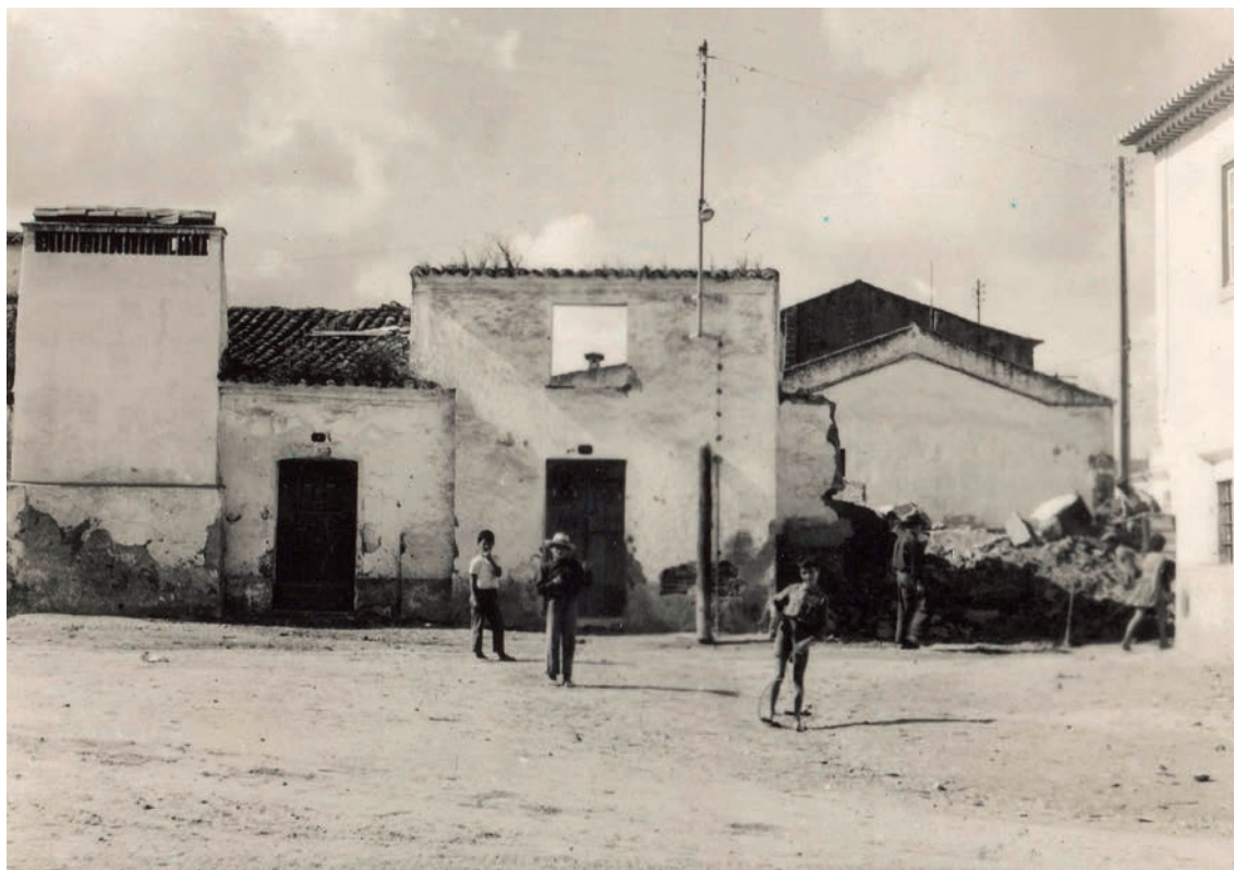
Figura 10 – Vista das fachadas das casas em pé documentadas durante a escavação, na praça de D. Manuel I.

mesmo muro localizam-se umas lajetas de cerâmica dispostas na horizontal (UE 44), que poderiam ser a base do alçado de terra ou uma remodelação posterior. No lado este ainda se conserva parte do reboco das paredes (UE 52).