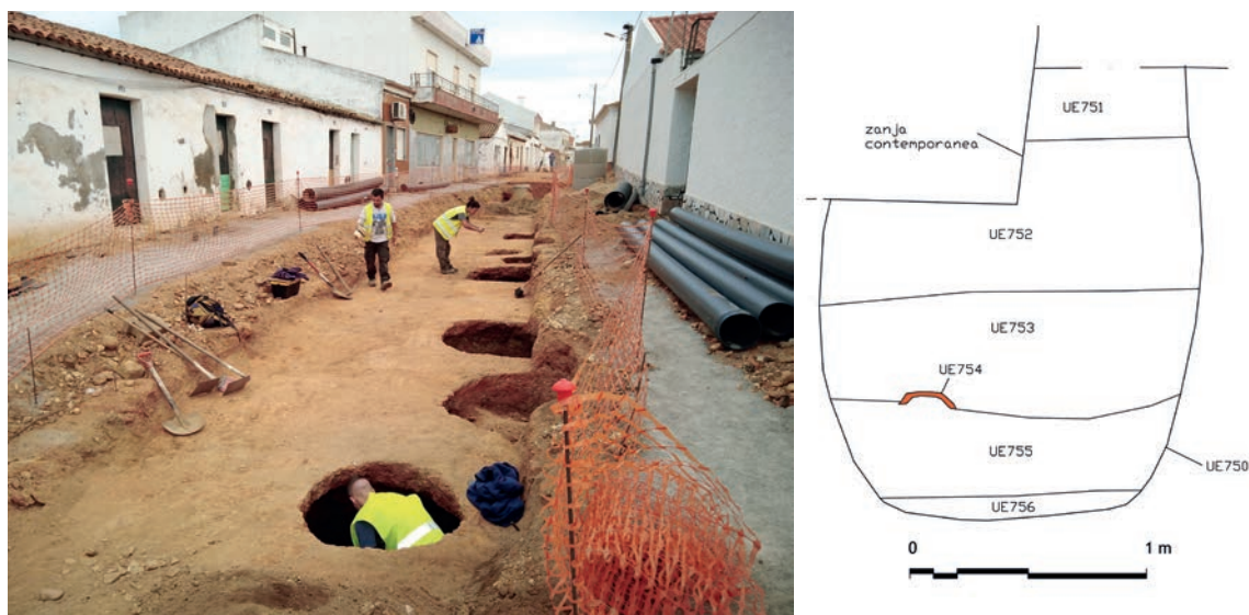
Figura 6 – Vista desde o sul da escavação da área de armazenagem na Rua de São Pedro e perfil do silo UE 750.

No entanto, a grande maioria da cultura material diz respeito à cerâmica comum, com formas diversas, destacando-se a cerâmica de uso culinário (caçoilas, panelas, tampas), mas também tigelas, pratos, um fragmento de cântaro e um candil. Recolheram-se ainda diversas formas de cerâmica (sobretudo tigelas e pratos) em vidrados melados, verdes, brancos, alguns destes decorados a corda seca, e peças com empedrados brancos que surgem no século XVII.