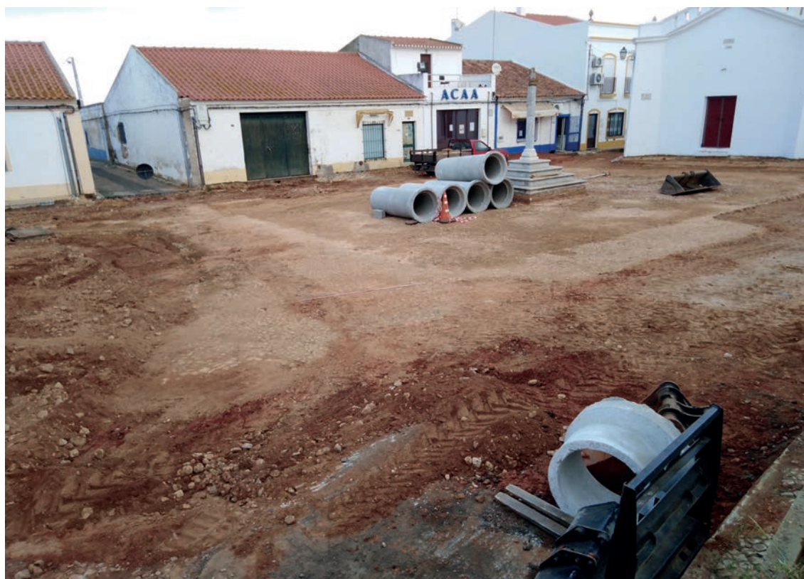
Figura 5 – Vista desde o sudeste da Praça D. Manuel I, com o pavimento antigo documentado nas escavações.

O pavimento original do largo (UE 31) desenvolve-se em frente à fachada principal da Igreja da Misericórdia e é constituído por terra argilosa avermelhada, muito compacta, com cal e seixos rolados de aproximadamente 4 cm. É delimitado por uma fila de seixos rolados, a maior parte alongados e de grandes dimensões (20 a 40 cm) que configuram um espaço retangular de 21 x 12 m (Fig. 5).