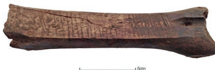
Figura 7 – Bigorna de foice da UE 752.

Estas descobertas permitiram reconhecer uma área específica na dinâmica da vila, dedicada ao armazenamento de cereais. O facto de existirem tantos silos no mesmo espaço e não associados a áreas habitacionais, numa área que se localizaria fora do centro da aldeia, fala da utilização comunitária destas estruturas, que se desenvolveram, de acordo com os poucos que se escavaram, entre os séculos XVI e XVII.