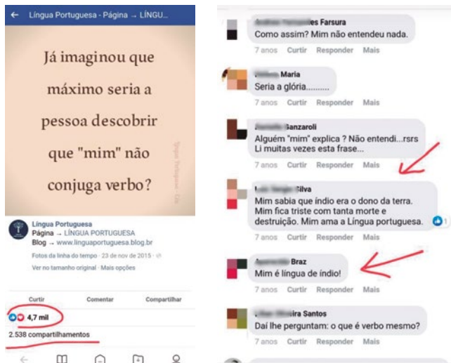
Figura 1. Postagem no Facebook do perfil “Língua Portuguesa” disponível em https://www.facebook.com/linguaportuguesa07/photos/a.271773609503284/1355524831128151/

alteridade constitutiva das relações nas múltiplas identidades. Então tanto o lugar do discurso sobre as línguas quanto o lugar do sistema da língua servem ao analista como objeto na medida em que ele puder interrogar as diferentes formas de produção da intolerância entre sujeitos em sociedade a partir da retórica da diferença. O imaginário de uma língua se vincula diretamente a um imaginário de seu falante e vice-versa; assim como o imaginário de língua suprema pressupõe um falante superior em relação a outros, suas (não)línguas, seus modos de vidas e existências desumanizados.