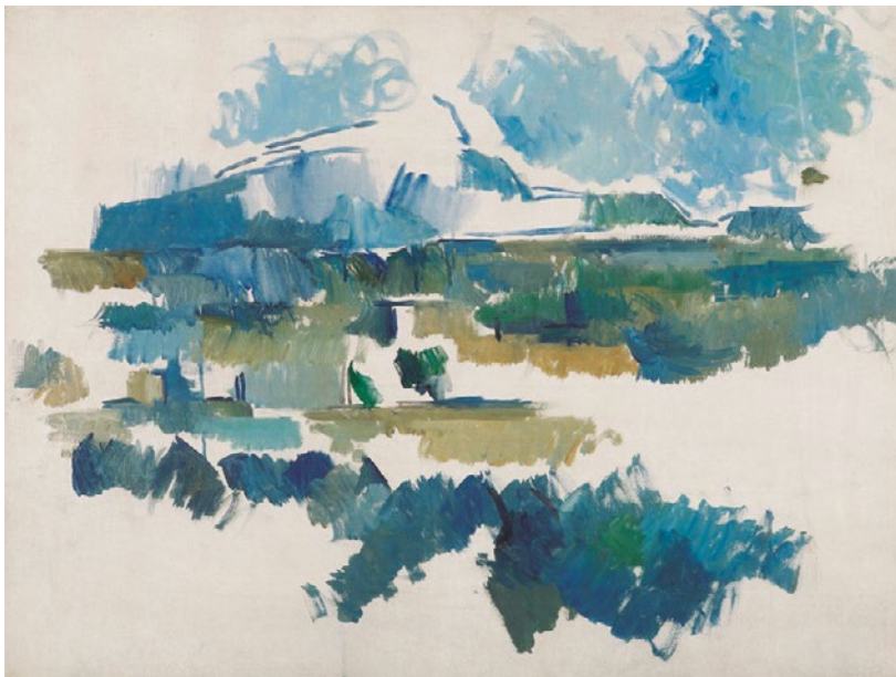
Figura 5. La Montagne Sainte-Victoire vue des Lauves , Paul Cézanne, 1901-1906.

1925 e 1934, e que nos lembram de que as imagens, assim como as palavras que a suscitam, podem não ser só meras representações, mas um ente em si, o filósofo berlinense dedica em seus excertos uma seção exclusivamente ao “Comer”.