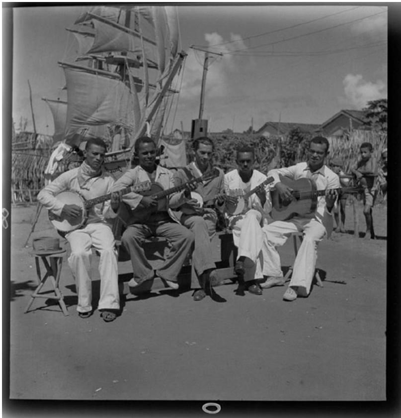
Figura 2. Barca (instrumentistas). Torrelândia, João Pessoa/PB, por Luís Saia. 24/05/1938. Fonte: Acervo do Cultural São Paulo: Missão de pesquisas folclóricas de Mário de Andrade. Tombo: FOT0366

mesmo grupo, há um fonograma 29 da performance de oito versos da Barca Nova ( La Galera de la Virgen ).