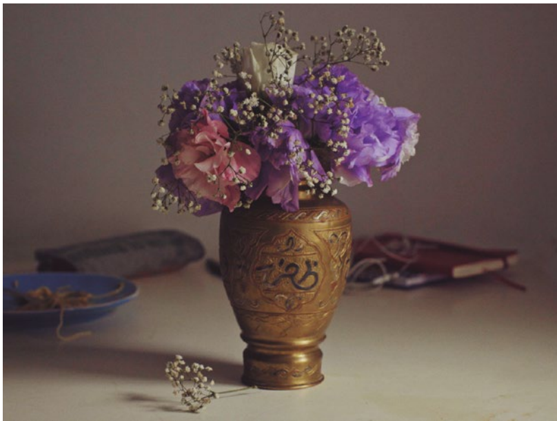
Figura 7. Imagem de abertura do filme A vida são dois dias (2022) e que circulou como uma das imagens de divulgação do filme.

Esse processo contínuo presente em meus filmes é algo que vai além de ser apenas o resultado de um determinado período ou de uma emoção momentânea, seguido pela ação de sentar na frente do computador e começar a escrever meu próximo projeto. Na verdade, é um processo em que vou acalutando e cuidando de diferentes filmes simultaneamente. Esses filmes nem sequer possuem uma forma definida ou um título concreto, eles já estão comigo desde o início. [...] Esse processo não é algo fechado ou vinculado ao sistema de produção cinematográfica tradicional, em que há uma busca por um autor ou escritor, que por sua vez busca um diretor, que busca um produtor e, finalmente, encontra um financiamento para que se possa filmar com uma equipe e lançar o filme em determinados lugares, apenas para recomençar o ciclo novamente. Isso não se aplica aqui. Desde o início, de certa forma, inclusive durante a faculdade, eu estava tentando hackear esse sistema, pois ele simplesmente não estava alinhado com minha vida nem com minha forma de pensar e vivenciar meus processos. (Mouramateus, 2022)