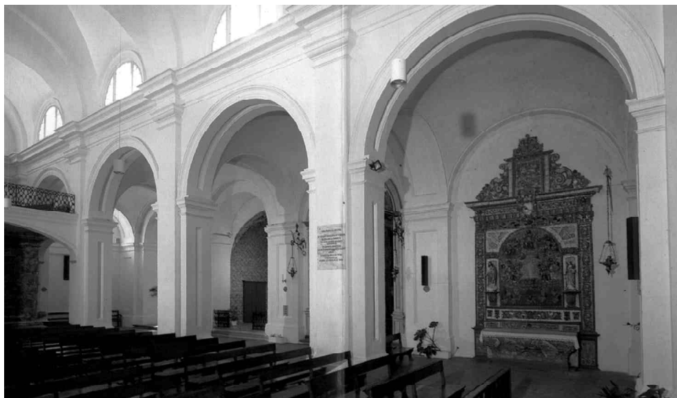
FIGURA 2. Igreja de Santa Maria do Castelo de Tavira.