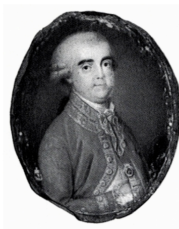
Figura 1 – D. Nuno de Moura Barreto, 6º conde de Vale de Reis, governador do Algarve entre 1786 e 1795. (Mendonça, 2005:64)