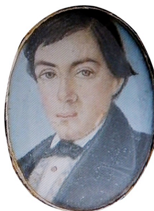
Figura 2 – Francisco de Borja Garção Stockler, 1º barão da Vila da Praia, governador do Algarve entre 1828 e 1829.