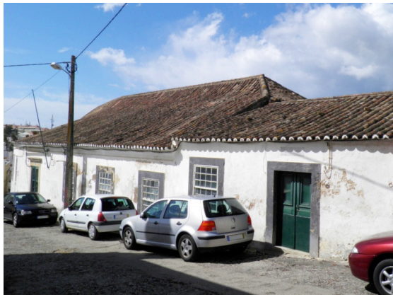
Figura 5 – Antigas casas da secretaria do governo e respectivas cavaliças.1795.