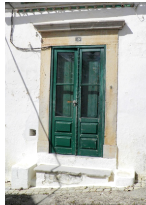
Figura 6 – Porta da antiga secretaria do governo, entre 1828 e 1829.