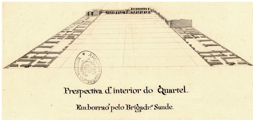
Figura 9 - Representação em perspectiva do quartel da Atalaia em finais do século XVIII. José de Sande Vasconcelos, Perspetiva do interior do Quartel (de Tavira) (AHM)