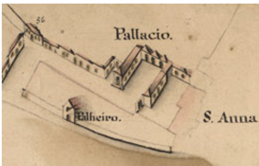
Figura 3 – O palácio dos governadores e a vizinha ermida de Sant'Ana no final do século XVIII. José de Sande Vasconcelos, Borrão do alçado da planta de Tavira .