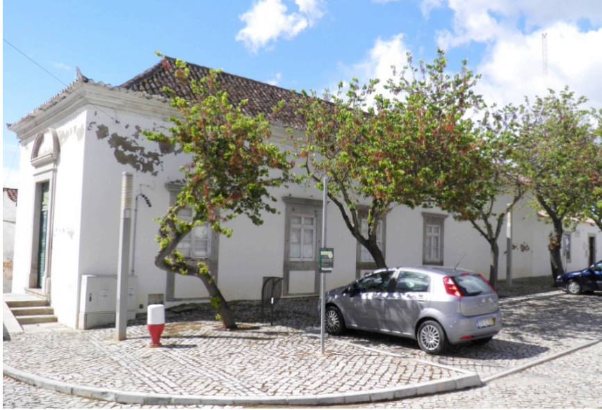
Figura 4 – O que resta do antigo palácio dos governadores, no Alto de Sant'Ana.