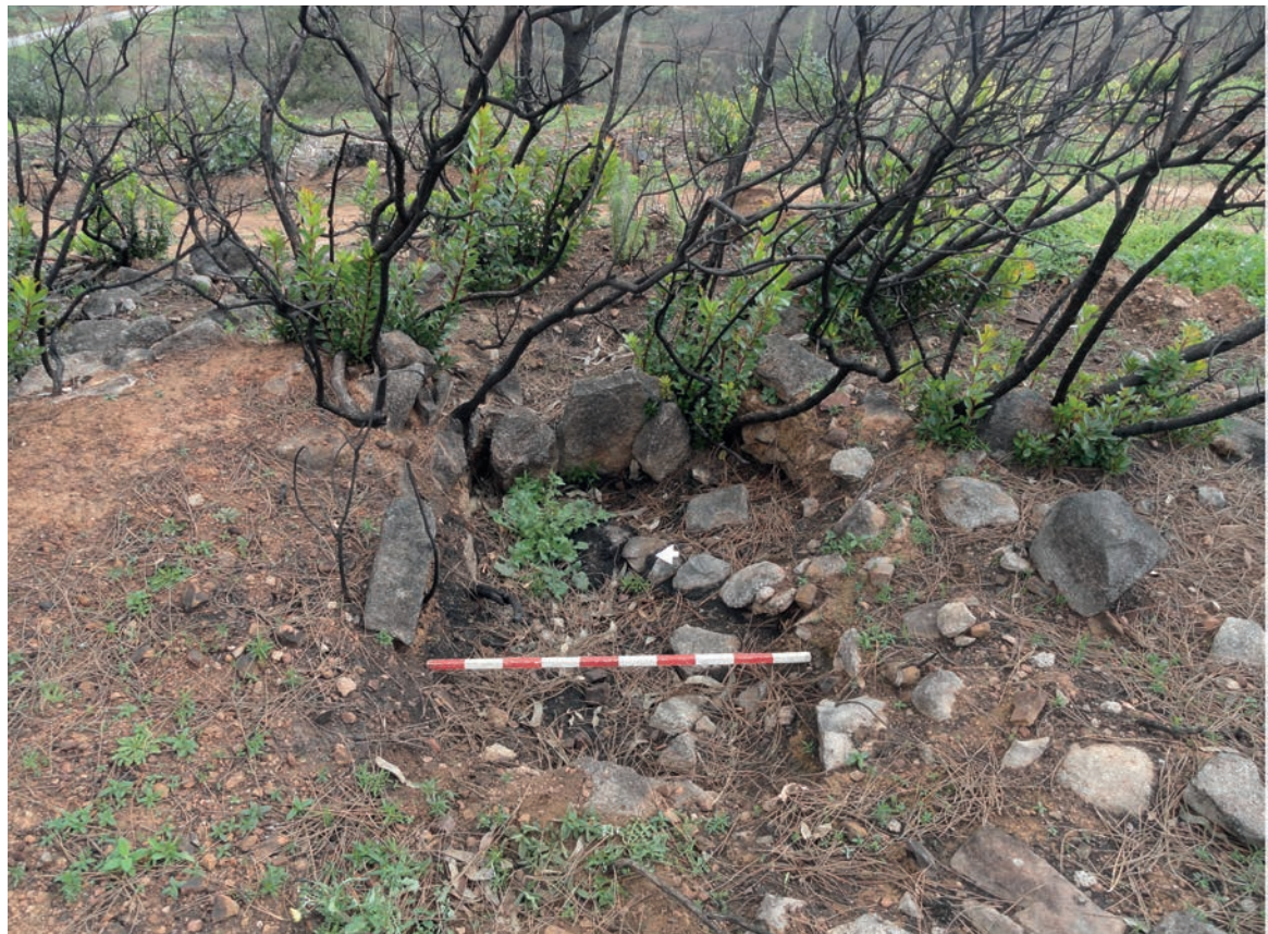
Figura 10 – Necrópole da Eira Cavada. Em cima: pormenor do limite sudoeste da mamoa n.º 2, que é atravessada por uma vedação. Em baixo: detalhe da câmara funerária da sepultura n.º 3 (vista de oeste).