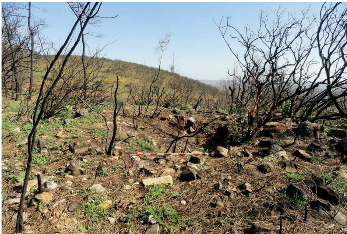
Figura 9 – Pormenor da parte oeste da mamoa identificada na área do antigo olival do Dr. José Júdice Samora Gil (vista de oeste). Ao longe verifica-se o cerro do Buço Preto, onde se encontram três mamoas que incluem as sepulturas n.º 1 a 5.