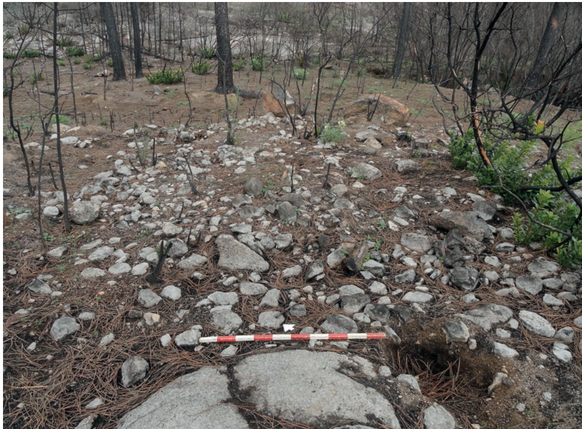
Figura 6 – Necrópole de Belle France. Em cima: pormenor da mamoa da sepultura Belle France 5 (vista de sudoeste). Em baixo: detalhe da mamoa da sepultura Belle France 6 (vista de sudoeste).