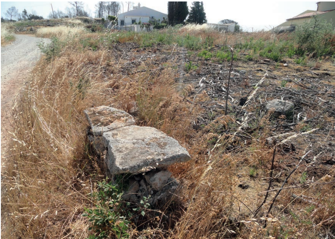
Figura 12 – Túmulo do Montinho. Detalhe da área onde terá sido efetuada a escavação arqueológica, em 1989, de uma sepultura sob mamoa (vista de sudoeste).

Considerando o relatório técnico da autoria de Teresa J. Gamito (1990), em 1989 procedeu-se neste local, uma elevação imediatamente a leste das Caldas de Monchique, à escavação de uma sepultura sob mamoa, que já se encontrava praticamente arrasada. Confrontando a planta de localização presente no mencionado relatório técnico com as informações orais facultadas por um antigo encarregado das Caldas de Monchique, a sepultura situava-se na parte noroeste da área atualmente designada por Montinho, junto ao caminho de terra batida que passa a escassos metros a noroeste das moradias atualmente existentes nessa área. Não se verificou qualquer indício da sepultura; somente se constatou a presença de uma pequena construção de pedra que condiz com a descrição efetuada pelo antigo encarregado das Caldas de Monchique.