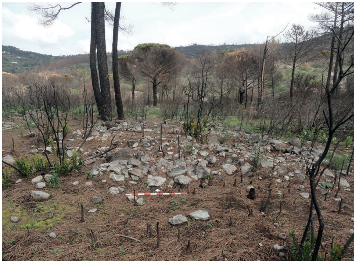
Figura 5 – Necrópole de Belle France. Em cima: pormenor da mamoia da sepultura Belle France 1 (vista de norte). Em baixo: detalhe da mamoia da sepultura Belle France 4 (vista de sul).