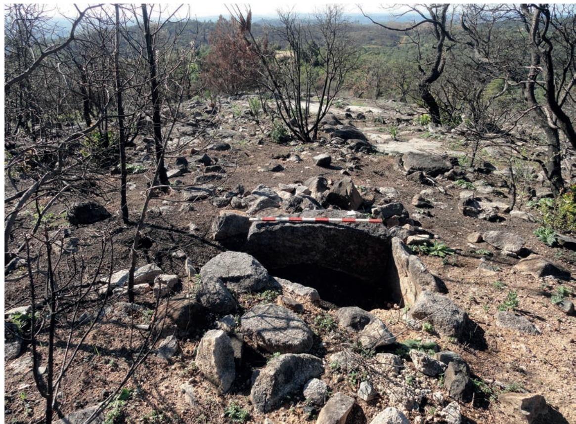
Figura 3 – Necrópole de Palmeira. Em cima: pormenor da câmara funerária da sepultura Palmeira 2 (vista de oeste). Em baixo: detalhe da câmara funerária da sepultura Palmeira 12 (vista de nordeste).