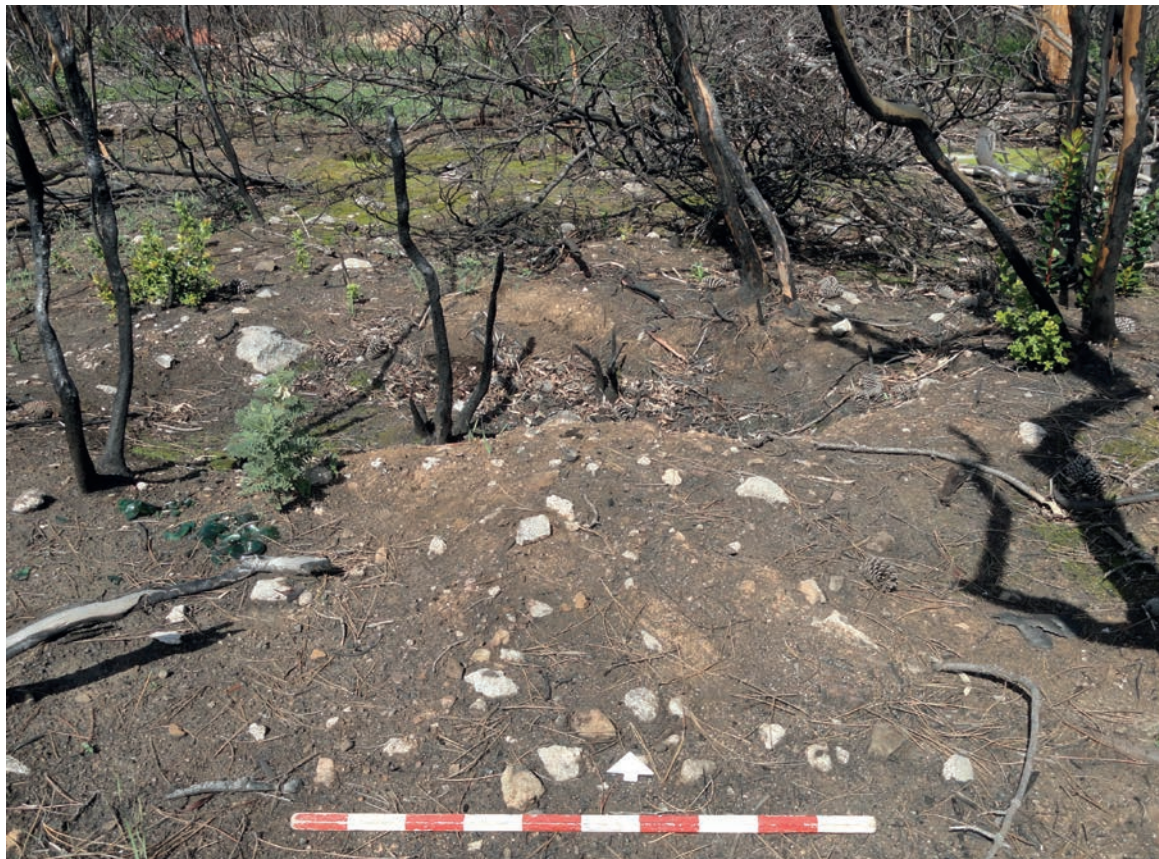
Figura 7 – Necrópole do Mirante da Mata. Em cima: possível limite norte de uma mamoa, provavelmente relacionada com a sepultura n.º 1 (vista de nordeste). Em baixo: possível mamoa muito arrasada, possivelmente relacionada com a sepultura n.º 3 (vista de sul).