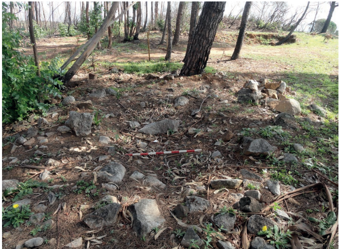
Figura 8 – Necrópole do Buço Preto. Em cima: pormenor do limite sul da mamoa que encerrava as sepulturas n.º 3, 4 e 5. Em baixo: detalhe da mamoa da sepultura n.º 8, verificando-se, ao longe, o limite norte da mamoa da sepultura n.º 7 (vista de noroeste).