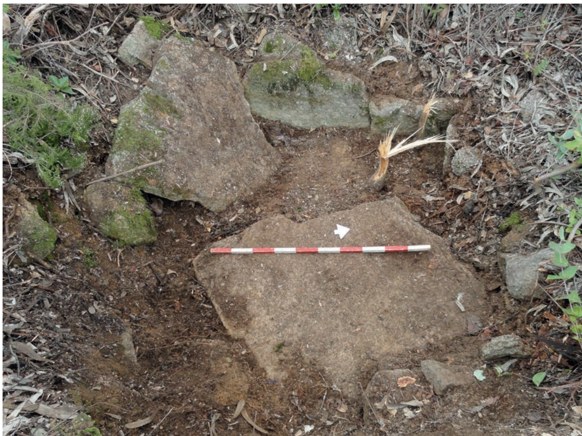
Figura 4 - Sepultura do Navete. Pormenor do estado atual da câmara funerária (vista de leste).