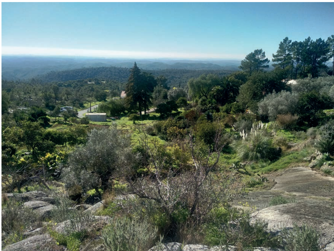
Figura 2 – Área onde se localizaria o túmulo do Rincovo (vista de norte).