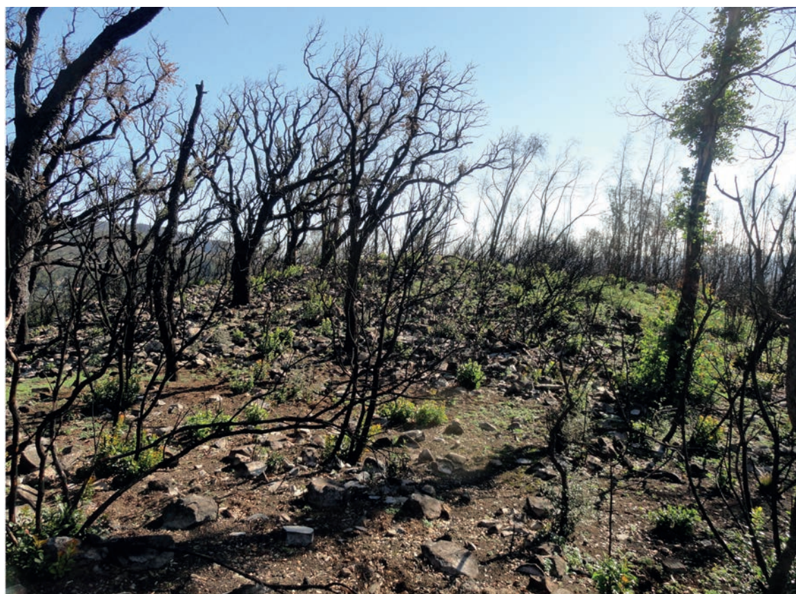
Figura 11 – Túmulo do Cerro do Ouro. Em cima: pormenor do topo da mamoa, verificando-se alguns esteios da câmara funerária a aflorar (vista de sul). Em baixo: detalhe do limite oeste da mamoa (vista de oeste).