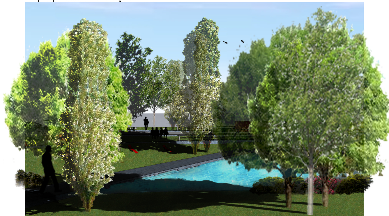
PERSPETIVA 03 Dique | Bacia de retenção