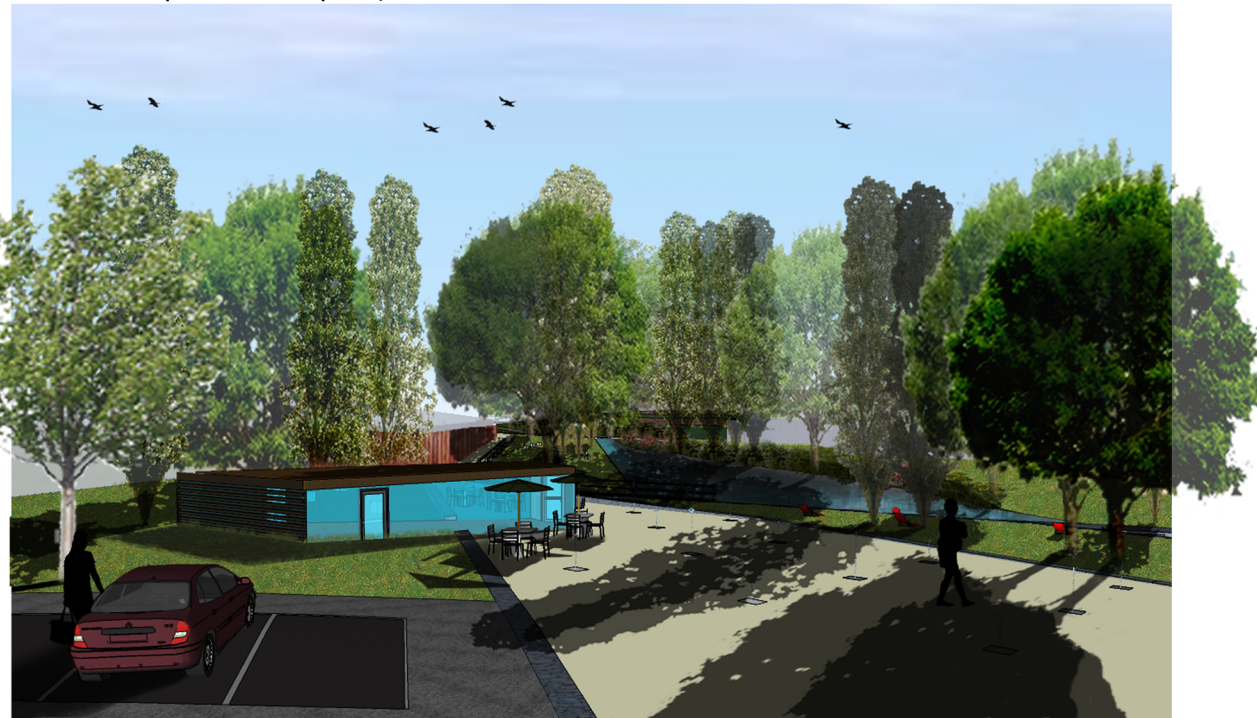
PERSPETIVA 01 "Alameda" | Cafetaria | Repuxos