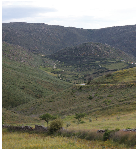
Fig. 5 Portela do Castelo de Monforte