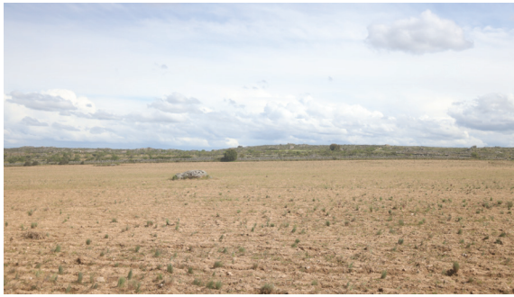
Fig. 6 Alto da Sentinela e Portela de São Bernardo, em Escalhão