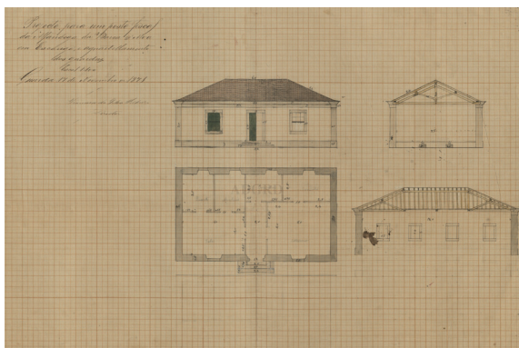
Fig. 10 Projeto para um posto fiscal da Alfândega de Barca d'Alva, em Escarigo (Arquivo Distrital da Guarda).