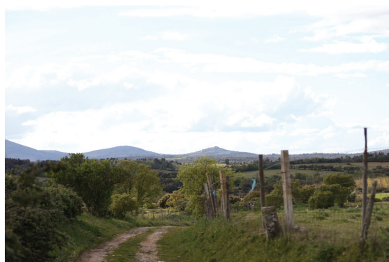
Fig. 3 Fotografia registada no Alto do Facho, com Castelo Rodrigo em segundo plano

Ribacôa 2 e a fundação do concelho de Castelo Rodrigo, em 1209.