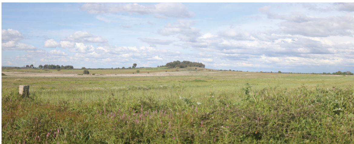
Fig. 4 Almenara de Mata de Lobos

D. Dinis calculou a ocupação de Ribacôa 7 procurando tornar consistente o “ordenamento do território” e a soberania sobre uma zona visivelmente fragilizada a nível político-administrativo. Por isso, após o Tratado de Alcanizes, D. Dinis foi responsável pela atualização das estruturas militares, ao longo da nova linha separatória 8 . No entanto, foram também outros registos de urbanidade – aldeias, póvoas novas e pequenas estruturas de vigia – que desempenharam um papel não menos importante na definição do espaço transfronteiriço 9 .