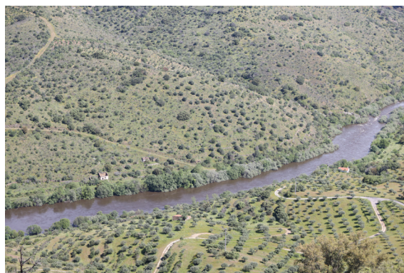
Fig. 11 Abrigos da Guarda Fiscal junto ao vau de passagem entre Escalhão e La Fregeneda