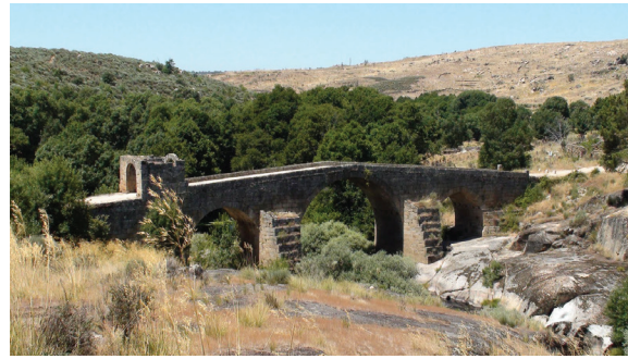
Fig. 7 Ponte de Sequeiros, em Valongo (José Carlos Callixto)

Atentando na toponímia, identificamos localidades como Porto de Ovelha, Valongo ( Portum Valongo ), Escabralhado ( Cabeçam Anaziado ) e Rebolosa ( Portum da Nave ) como um alinhamento estruturado de locais de controlo da passagem (para mercadorias, pessoas e animais) com respetivos portos e poldras, no rio Côa, na ribeira de Alfaiates e no rio Cesarão 17 . O ponto de passagem sobre o Côa, junto a Caria Talaia e Rapoula, constituía uma parte do percurso de rebanhos transumantes. O Porto de Carros (Santos, 2018, pp. 31-32), inscrito na antiga “via Colimbriana”, estabelece um vau de passagem próximo de Castelo Bom e de Castelo Mendo.