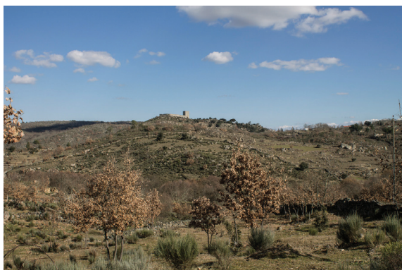
Fig. 2 Castelo de Vilar Maior, vista do lado poente