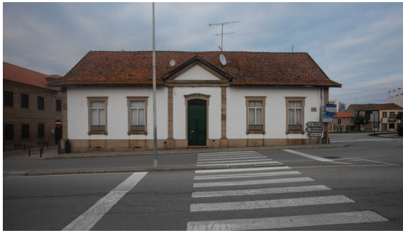
Fig. 8 Registo fiscal de Figueira de Castelo Rodrigo