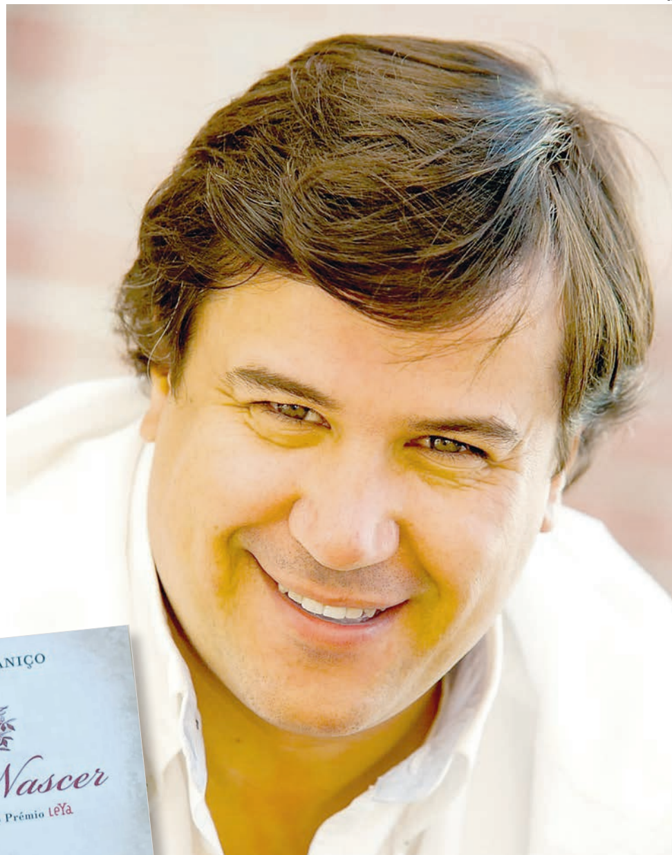
“Mal Nascer” é a obra mais recente do escritor

(vivem-na todos) com a dignidade possível («Ela olha-me e não tem coragem de me dizer que não tem comida para mim e finge não saber que eu nada comi. Também eu tenho vergonha de dizer que tenho fome