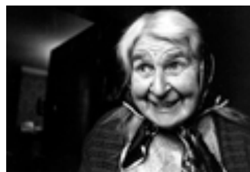
Fragments Between Time and Angels, de Pedro Sena Nunes

Estou desperto, estou disposto e quero o desafio. Outra coisa que tento mesmo promover, quer para a minha tendência ou para eu, enquanto criador, o eu criador com uma visão ou a promoção de outros que me acompanham ou que querem participar desta ou daquela maneira mais perto, é olhar a necessidade, perante este mundo de imagem que todos os dias se cria à tonelada, qual é o nosso lugar, o que é que nos distingue, como é que eu vejo e ouço um filme, como é que eu olho para ele e penso nele como um corpo, um corpo que pulsa, que tem um tempo, que cria um desafio, que cria um despiste, que tem fragilidades, como é que eu o sinto? Sempre numa perspectiva de que estamos a narrar, mais ou menos explicitamente, mas que somos sobretudo visionários – mas visionários de grande rigor. Sem o rigor, a coisa não funciona de todo. ■