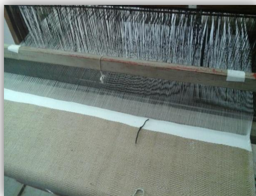
3.6.4- Figura nº4 – Manta d fio de juta e algodão