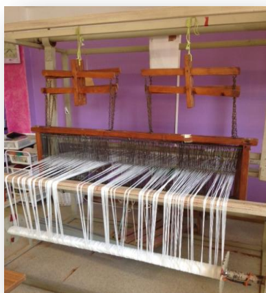
3.6.4.-Figura nº3- Tear de pedais