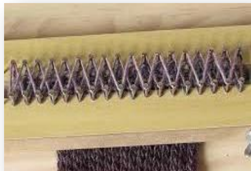
3.6.4-Figura n. °2 -Tear de pregos