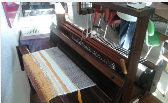
3.6.4- Figura nº1- Tear de manípulos