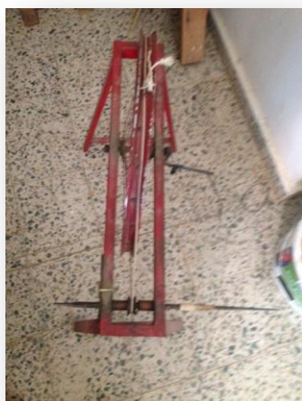
3.6.4-Figura nº5 – Debadora