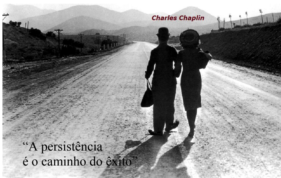
Frase: Chaplin, C. Imagem filme: Tempos modernos (1936). Produção e direção: Charlie Chaplin - Produtora United Artists

“O maior pecado capital que os educadores podem cometer é destruir a esperança e os sonhos [...] Sem esperança não há estrada, sem sonhos não há motivação para caminhar [...] se tem esperança e sonhos, ela tem brilho nos olhos e alegria na alma. [...] Não importa o tamanho dos nossos obstáculos, mas o tamanho da motivação que temos para superá-los.” (Cury, 2003)