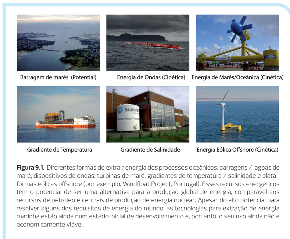
Figura 9.1. Diferentes formas de extrair energia dos processos oceânicos: barragens / lagoas de maré, dispositivos de ondas, turbinas de maré, gradientes de temperatura / salinidade e plataformas eólicas offshore (por exemplo, Windfloat Project, Portugal). Esses recursos energéticos têm o potencial de ser uma alternativa para a produção global de energia, comparável aos recursos de petróleo e centrais de produção de energia nuclear. Apesar do alto potencial para resolver alguns dos requisitos de energia do mundo, as tecnologias para extração de energia marinha estão ainda num estado inicial de desenvolvimento e, portanto, o seu uso ainda não é economicamente viável.

ção de energia de marés não são economicamente viáveis em larga escala, estando ainda num estado prematuro de desenvolvimento. Foram já vários os dispositivos testados, subjacentes a diferentes conceitos físicos, mas só alguns se tornaram protótipos à escala real. Isto porque o desenvolvimento comercial de energia marinha depende em grande parte da capacidade de os projetos piloto demonstrarem viabilidade técnica, económica e ambiental.