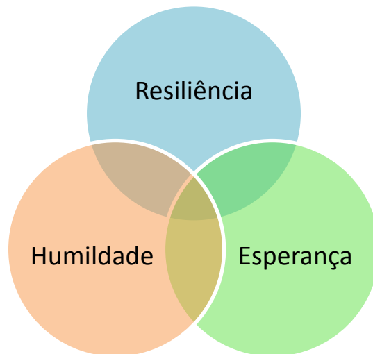
Figura 1 – Interconexão entre Humildade, Esperança e Resiliência

Pela observação da figura prévia pode referenciar-se que cada virtude tem uma força que lhe é própria e singular porém demonstra, simultaneamente, união e força quando em conexão com as outras duas, que corresponde à área em comum das três virtudes.