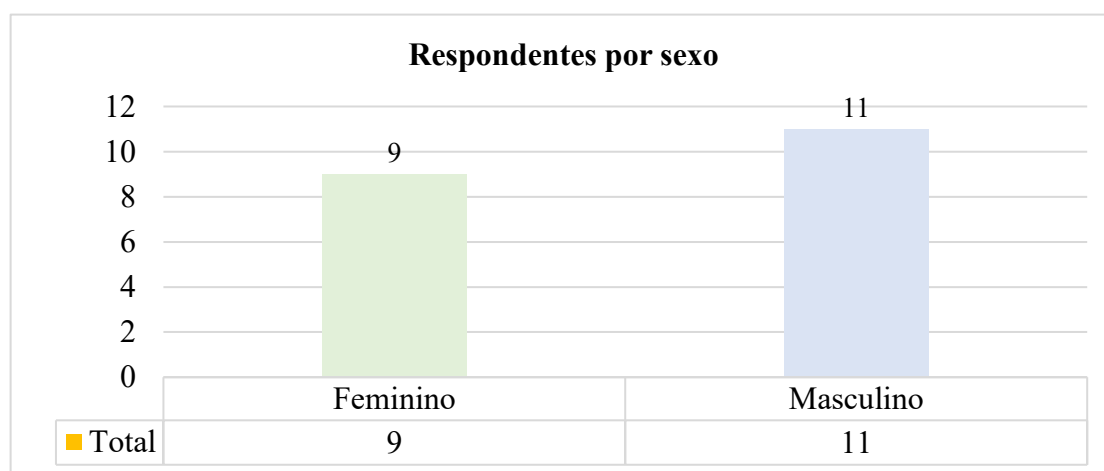
Gráfico 3.1. Respondentes por sexo

A pergunta sobre o sexo de cada um(a) permitiu que se verificasse um total de 9 respostas do sexo feminino e 11 do sexo masculino, ficando a faltar uma resposta do sexo masculino (gráfico 3.1.).