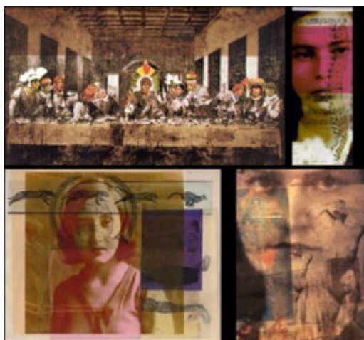
Figura 1 – Sem Título

A imagem no quadrante esquerdo superior apresenta uma colagem com sobreposição não apenas entre temporalidades, mas, sobremaneira, entre territórios simbólicos e paradigmas que operam em níveis plásticos e historiográficos da arte. Apresenta variação de imagem canônica do período do renascimento e povos tradicionais. Uma articulação questionadora que atravessa a linha de composição e ganha contornos políticos.