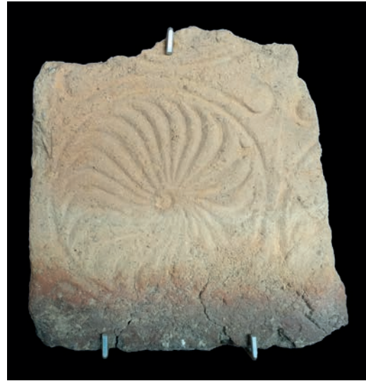
Figura 8 – Fragmento de placa cerámica procedente de Tábua (distrito de Coimbra). Museu da Sociedade Martins Sarmiento de Guimarães.

Hemos dejado para el final el que seguramente sea el hallazgo más interesante de todos, el de la Villa romana de Milreu (Estoi, Faro), que actualmente se conserva en el Museu Nacional de Arqueologia, en Lisboa (Almeida, 1962, p. 232-233, figs. 302-304; Teichner, 2006). Esta villa fecha sus primeras construcciones entre los siglos I y III (Teichner, 2006, p. 209), si bien la mayor parte de