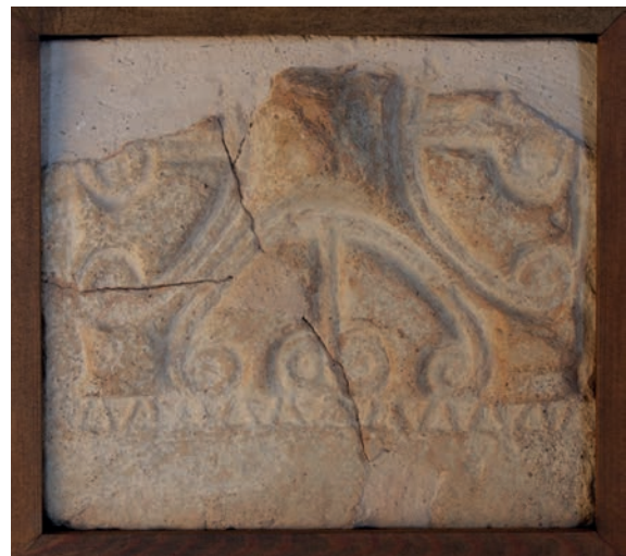
Figura 4 – Fragmento de placa cerámica procedente de la necrópolis de El Lomo (Bollullos Par del Condado, provincia de Huelva). Museo de Huelva.

El último ejemplar de los que tenemos constancia que se conservan en este museo se localizó en el yacimiento de El Lomo, en la localidad de Bollullos Par del Condado. En una intervención arqueológica realizada en 1994 se halló un fragmento de placa decorada, del tipo de peltas y protuberancia troncopiramidal en el centro (Fig. 4), que fue reutilizado como material constructivo en la llamada «Tumba 2» (García González, 1997). El interés principal que posee este ejemplar deviene del contexto de su hallazgo, puesto que permite aproximar una cronología para su fabricación. Fue hallado en el interior de una sepultura que forma parte de una necrópolis fechada por sus excavadores entre fines del siglo IV y la segunda mitad del VII (García González, 1997, p. 295). Sin embargo, atendiendo a las características constructivas de la tumba y a los elementos del depósito ritual que albergaba, se puede matizar la datación y concretarla hacia el siglo V, y siempre antes del VI (Ruiz Cecilia y Román Punzón, 2018, p. 555, nota 24). Esta cronología establece un interesante terminus ante quem para esta placa, que debe ser, necesariamente, de una fecha anterior a ese siglo VI.