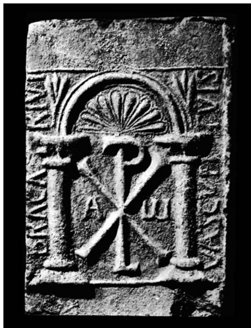
Figura 7 - Placa cerámica de la serie de Bracario procedente de Mérida, según Palol (Palol, 1961, fig. 11).

Así, y como ya habíamos señalado, en el territorio portugués aún no tenemos constancia cierta del hallazgo de placas cerámicas decoradas como las que hemos visto hasta ahora. La cercanía de localizaciones, al menos por la parte onubense, y el caso, hasta ahora aislado de Tábua, del que hablaremos a continuación, permiten suponer que no sería extraño que se produjeran futuros hallazgos, bien en excavaciones o prospecciones arqueológicas, bien mediante el rastreo de referencias bibliográficas o en los fondos de instituciones museísticas.