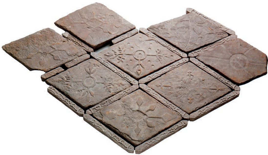
Figura 6 – Losetas de Burguillos del Cerro, provincia de Badajoz (Maufus, 1991, p. 235). Museo Arqueológico Nacional.

Sin embargo, como ya hiciera constar Palol (Palol i Salellas, 1967, p. 256), aunque puedan relacionarse con las placas cerámicas, estas piezas poseen una función distinta ya que conformaban una parte del pavimento del edificio. Es una rareza que losas de pavimento de un templo, que se supone que debe ser muy transitado, posean una decoración en relieve ya que se deteriorarían con relativa facilidad (Arias Sánchez y Balmaseda Muncharaz, 2006/2008). Para la salvaguarda del mismo, se ha señalado la posibilidad de que quizás pudiera estar relacionado con una zona cementerial, algo que no sería extraño en época visigoda, a pesar de que estuviese prohibida tal práctica dentro de los templos (Arias Sánchez y Balmaseda Muncharaz 2006/2007/2008, p. 113). En todo caso, como ya hemos indicado, tanto por la tipología como por la funcionalidad apuntada hasta el momento para las placas cerámicas decoradas tardoantiguas, este ejemplo de Burguillos no se podría incluir, sensu stricto , entre el fenómeno que nos ocupa.