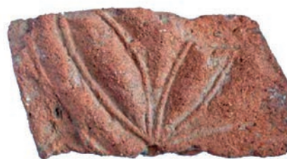
Figura 5 - Fragmento de placa cerámica procedente del yacimiento Monte de San Miguel II (Aracena, provincia de Huelva) (Romero Bomba et al., 2018, fig. 6).

Por otro lado, hemos tenido conocimiento de la existencia de un fragmento (Fig. 5) procedente del yacimiento denominado Monte de San Miguel II, en el término municipal de Aracena, que se ha interpretado como una posible basílica. Su pequeño tamaño sólo permite observar la existencia de tres hojas lanceoladas, probablemente, pertenecientes a una flor o roseta de seis pétalos (Romero Bomba et al., 2018, p. 378, fig. 6). Por otro lado, el tratarse de un hallazgo aislado y descontextualizado impide apuntar nada al respecto de su funcionalidad.