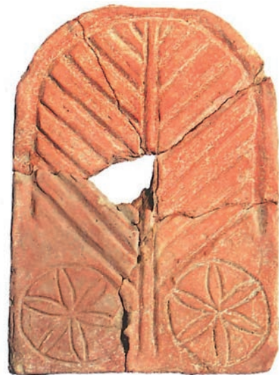
Figura 9 – Placa cerámica procedente de Villa Cardílio (Torres Novas, distrito de Santarém). Museu Municipal Carlos Reis, Torres Novas.