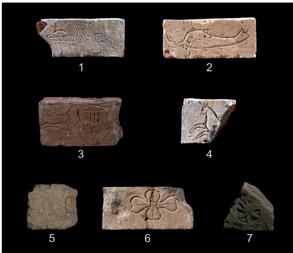
Figura 10 – Ladrillos procedentes de la villa romana de Milreu (Estoi, distrito de Faro). Museu Nacional de Arqueologia (imágenes tomadas de la web MatrizNet). Piezas a diferentes escalas.

. 4. N.º inventario 997.17.1: fragmento de placa, del que se conserva una parte del lado izquierdo, en el que se aprecia la mitad delantera de un caballo a galope. Medidas: 10,5 x 8,7 cm.