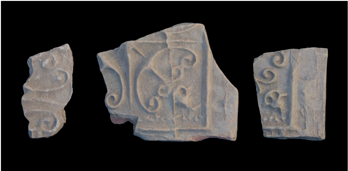
Figura 3 – Fragmentos de placas cerámicas procedentes de la ciudad de Huelva. Museo de Huelva. Piezas a diferentes escalas.

En cuanto a los fragmentos (Fig. 3), tres de ellos fueron entregados por Antonio Ruiz Arazo como procedentes de la propia ciudad de Huelva, sin mayor precisión (Ruiz Cecilia y Román Punzón, 2018, p. 555-557).