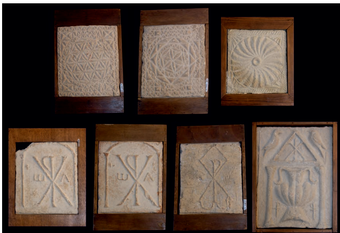
Figura 2 – Placas cerámicas decoradas del Museo de Huelva. Piezas a diferentes escalas.