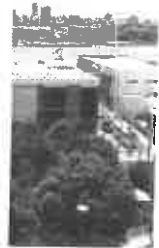
la Estação da duplicação, em