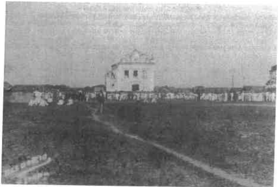
Figura 7- Festa das Neves. Fotografia ofertada ao Pe. Serafim Leite, em 1939.