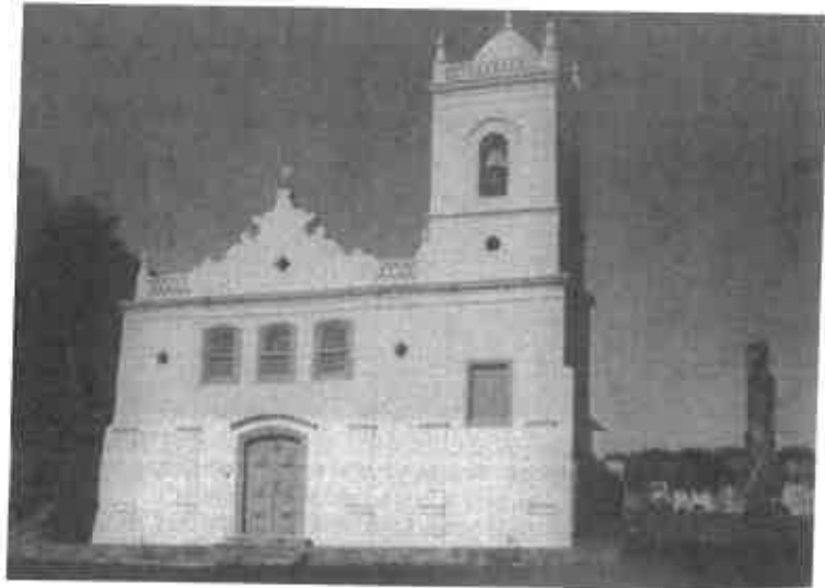
Figura 10 – Fachada da Igreja de N. S. da Ajuda, após as obras de restauração de 1969.