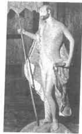
Figura 3 – Igreja de São João Batista