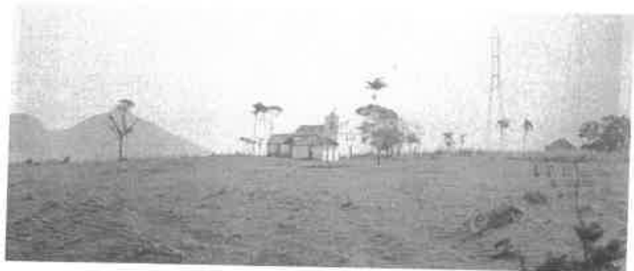
Figura 5 – Implantação da Igreja de São João Batista.

o aldeamento de Reritiba. F. 36.695. (c) Antigo o: Cx.0099, Pt.02, E.03, reja dos Reis Magos e .N/ANS/Série Inventário Araçatiba. Fonte: ) Antigo aldeamento de Pt.03, E.02, F. 8.973.