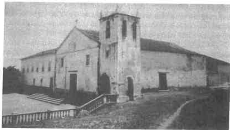
Figura 9 - Fotografia que orientou a restauração do edifício de Anchieta na década de 1960.