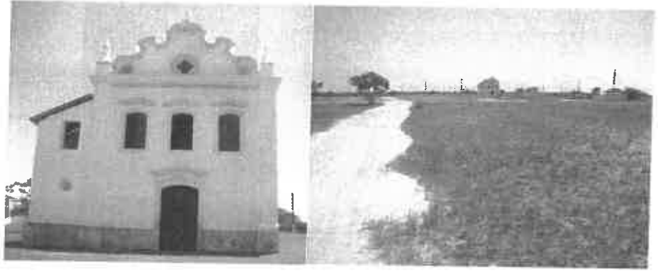
Figura 6 - Igreja de N. S. das Neves e adjacências.