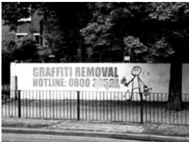
fig 1: Graffiti como arte pública, Glasgow

industriais desactivados (vide Figura 1). Existem em Inglaterra, 6.500 milhas de ciclo via a fazer a ligação entre os centros urbanos e o meio rural, onde se incluem centenas de exemplos de arte pública ao longo da via (Mosedale, 2006). A arte pública funciona, fundamentalmente, como catalizador de um processo de regeneração urbana mais abrangente, estimulando a criatividade e melhorando a imagem da cidade e pode incluir desde mobiliário urbano, a projectos comunitários, a instalações temporárias ou até exposições.