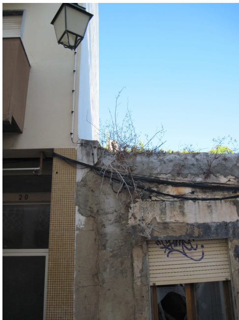
3766. precedência confinante, igual pé direito mas diferente altura; notar candeeiro e cabos eléctricos