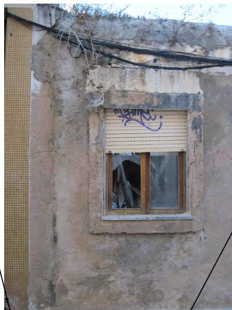
3765 – estore a meia haste