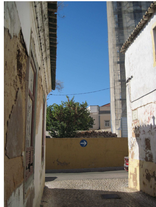
3801 - Rua Manuel Lobo, do lado da Igreja