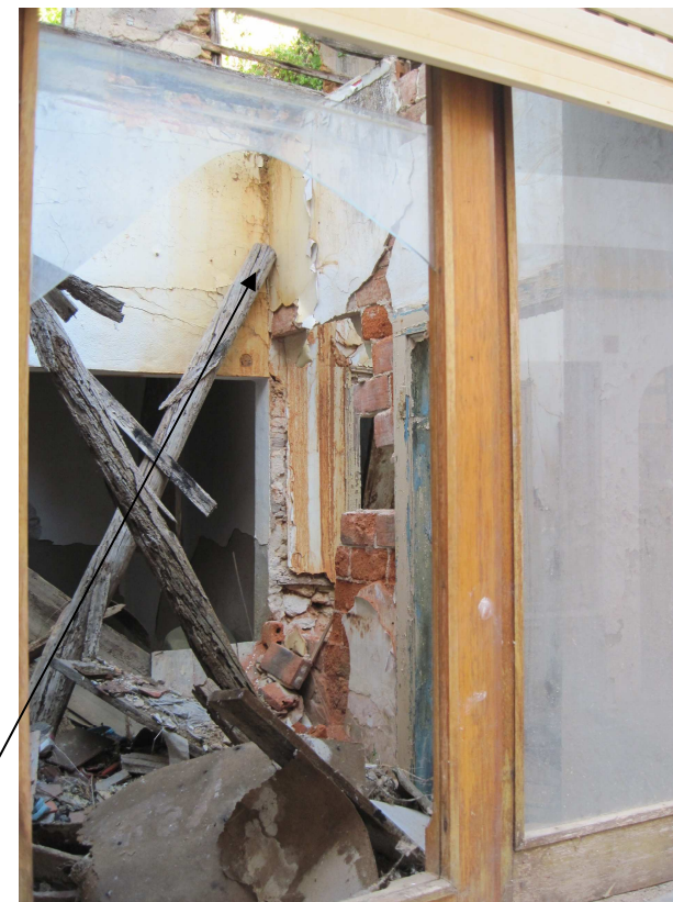
3767 – tecto aberto, barrotes cruzados em X exibindo agência humana (proprietário, herdeiro, funcionário público, passante?..) de espécie de gestão de ruína'?