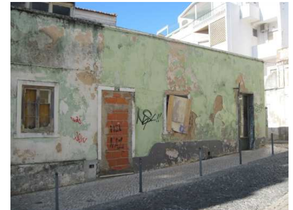
3760 – galeria de arte ex-positiva