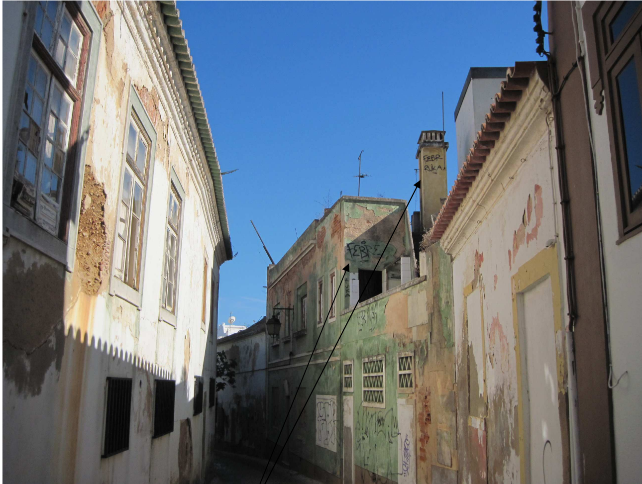
3797 – R. Manuel Lobo qual adarve de prédios devolutos e febris