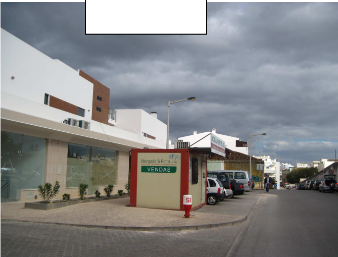
2695 11/11/2010 14h08