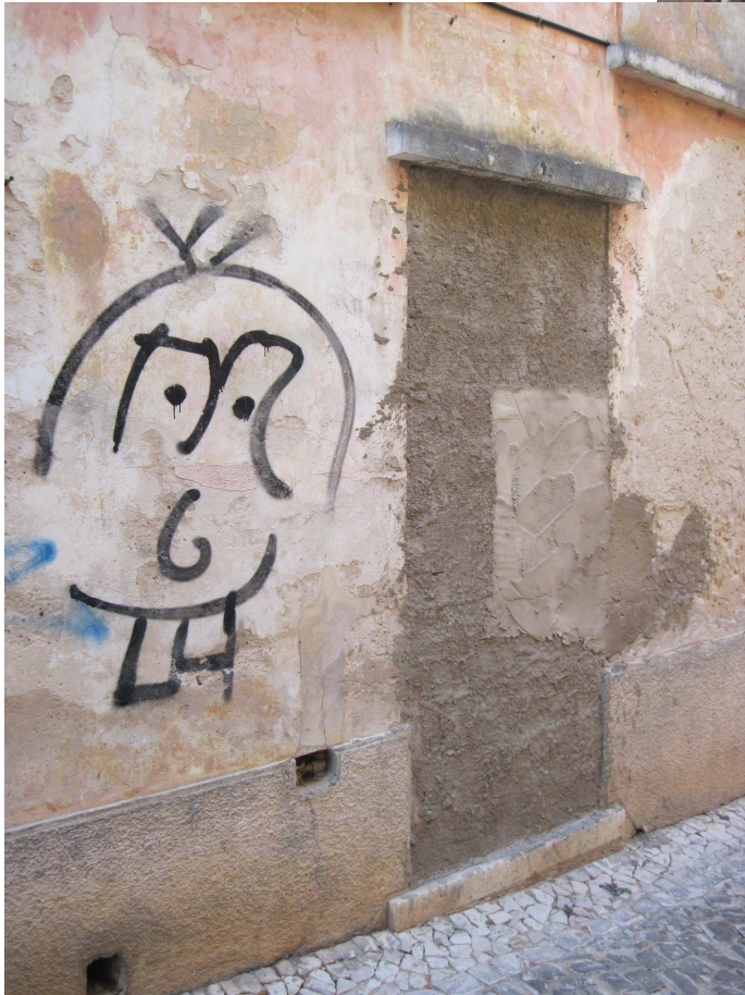
3804 - Porta entaipada, camadas de reboco de cimento, tag de smile apreensivo?