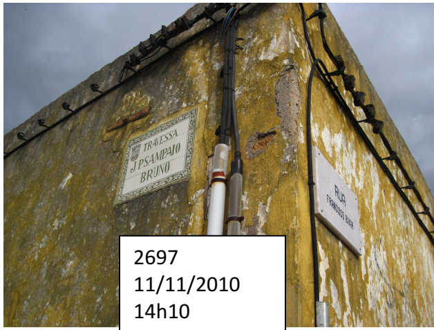
2697 11/11/2010 14h10

À esq., Quinta das Laranjeiras, condomínio privado; à dta., frente do prédio devoluto (com instalação móvel ) cuja esquina delimita a Travessa JP Sampaio Bruno e a Rua Francisco Bívar cf. foto 2697;