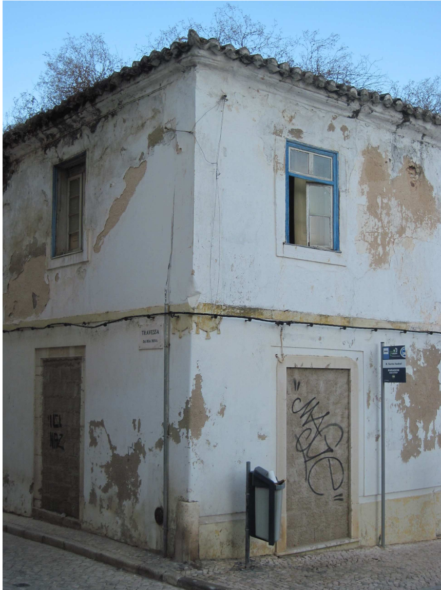
3995 – mais uma esquina de portas ‘entaipadas’ a cimento, do lado oposto à “Loja de Reabilitação Urbana”