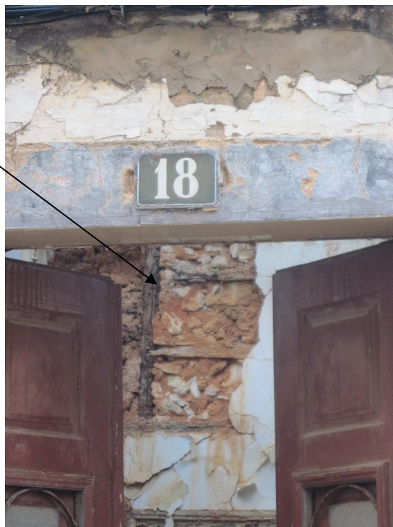
3770 – travejamentos de madeira à vista;