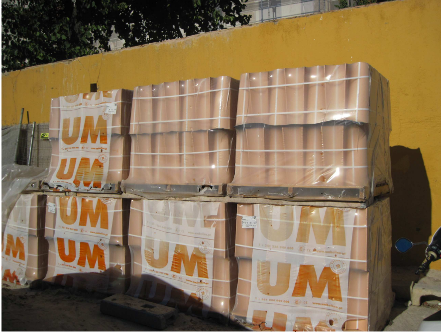
3795 – telha para a Igreja em ‘restauro’ 1