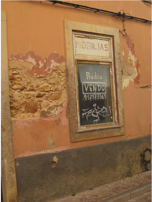
3785-7-4 - Signos, da direita para a esquerda: de janela de venda de móveis a imóvel à venda (917573369); aviso e nova instalação canina ; cedência de passagem mobilizada e [ex-] sede do PSD