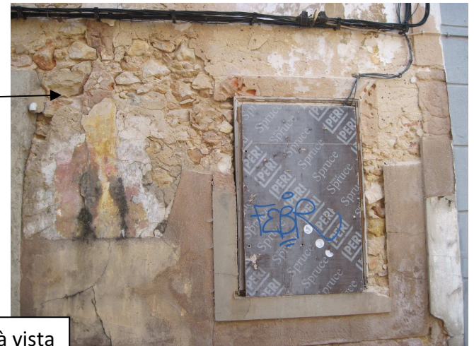
3781 – estrutura à vista