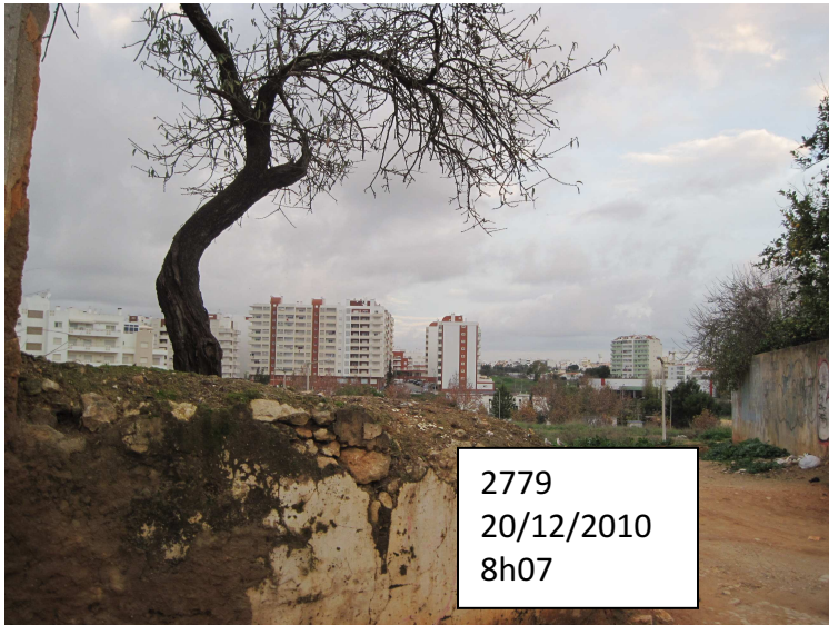
2779 20/12/2010 8h07