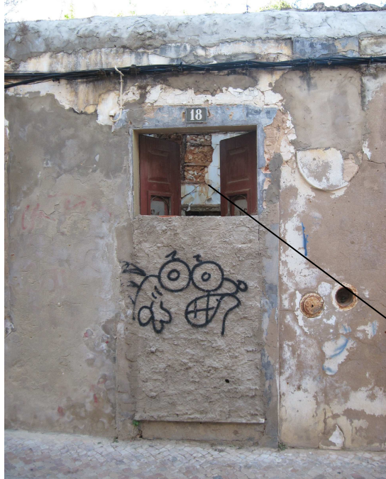
3769 – porta blindada/entaipada a tijolo cozido rebocado a cimento, a 2/3 – e de novo a perplexidade canina ;