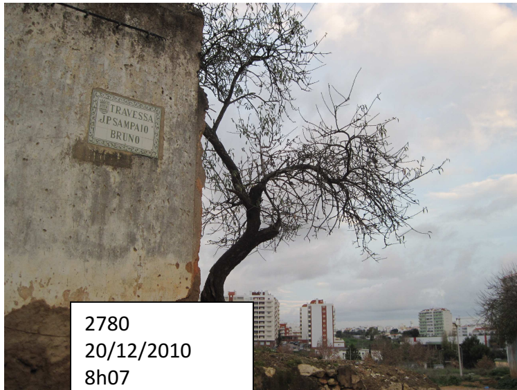
2780 20/12/2010 8h07

Confinâncias da Travessa Sampaio Bruno unidas pela ruína; aberta a um baldio encimado por uma alfarrobeira esquecida , por um lado, que nomeadamente dá acesso pedonal ao Pingo Doce, Loja II