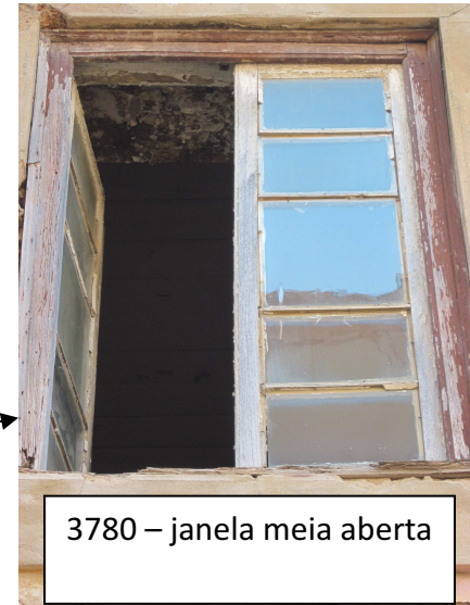
3780 – janela meia aberta