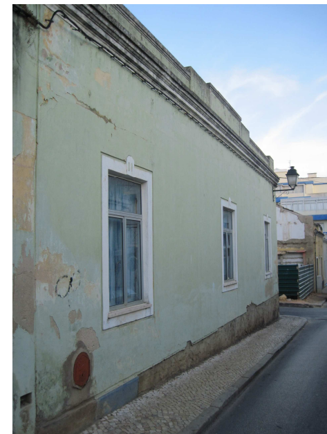
Ao topo da Rua Viscondessa de Alvor, na esquina com a R. Alexandre Herculano, pormenores de um prédio devoluto