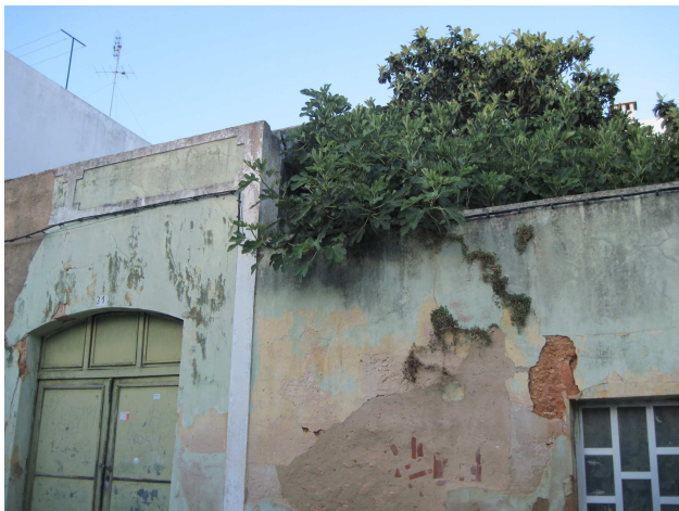
Porta-Figueira-Osgas em display