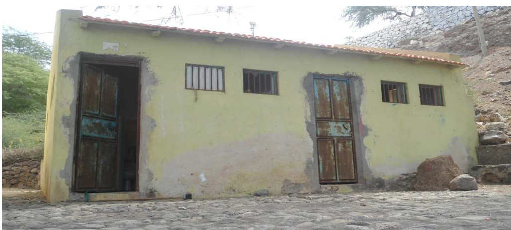
Fig.3 WC público abandonado e degradado