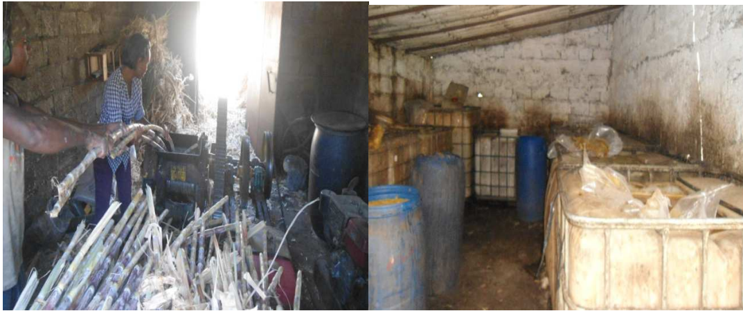
Fig.6 Alguns processos na produção do grogue (Moagem da cana de açúcar e fermentação da calda)