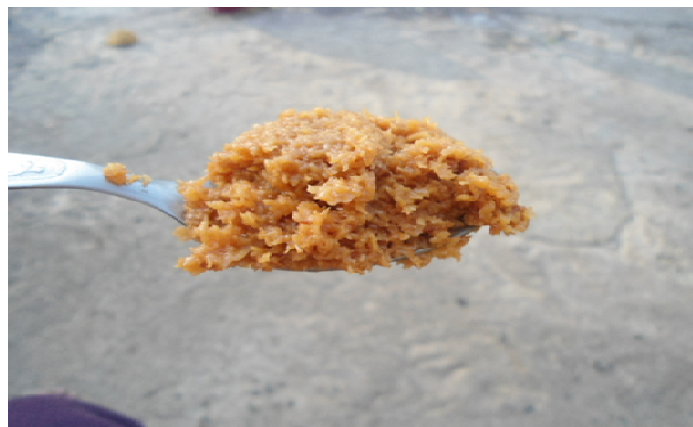
Fig.11 Doce de coco tradicional de Cidade Velha produzido pela D. Filú