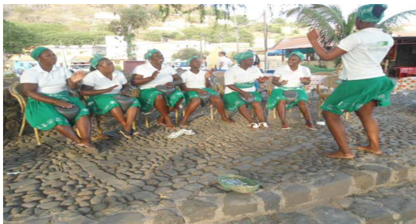
Fig.13 Atuação grupo de batucadeiras de Cidade Velha, denominado “Fortaleza”