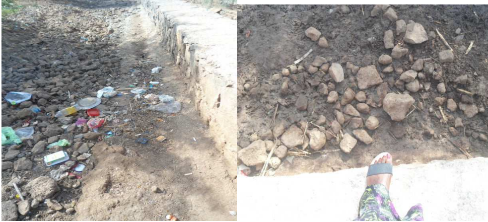
Fig.17 Acesso Pedonal: Fortaleza ao centro do Sítio Histórico.