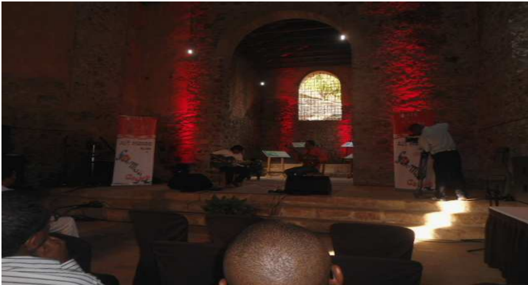
Fig.9 Evento no Convento São Francisco – organizado pelo Ministério da Cultura