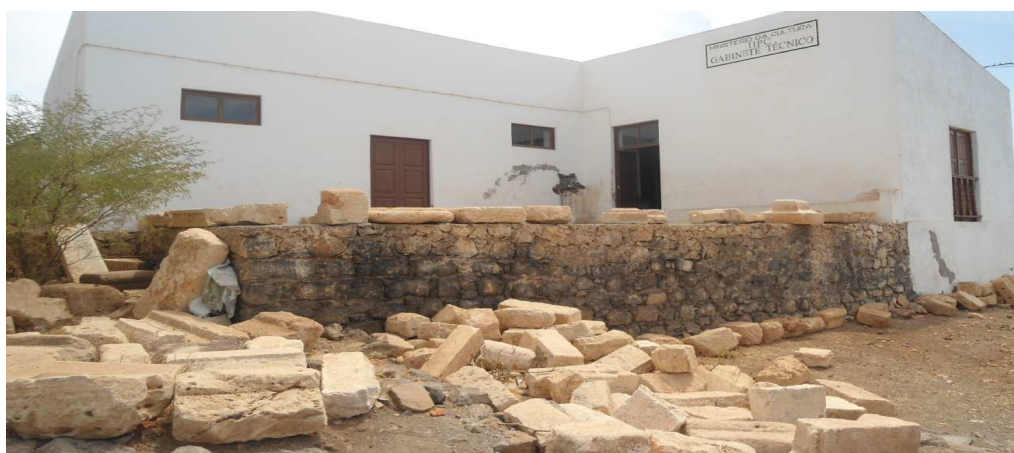
Fig.1 Gabinete do Instituto de Investigação do Património Culturais, IIPC, em Cidade Velha