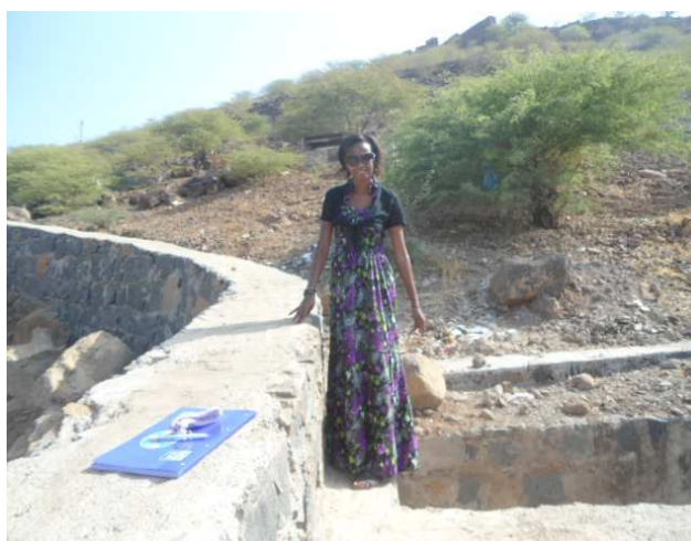
Fig.16 Acesso pedonal Fortaleza ao centro do Sítio Histórico (carece de obras e limpeza)