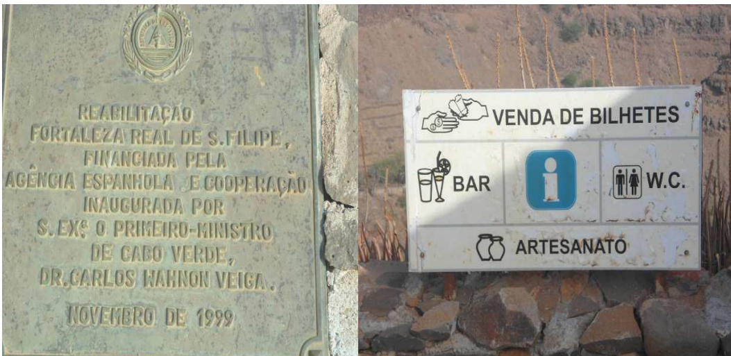
Fig.18 Placa informativa existente. O que existia aquando da candidatura a Património Mundial estão degradados.