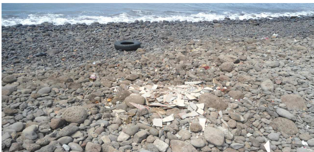
Fig.2 Lixo diverso deixado na Praia (em frente temos os restaurantes)