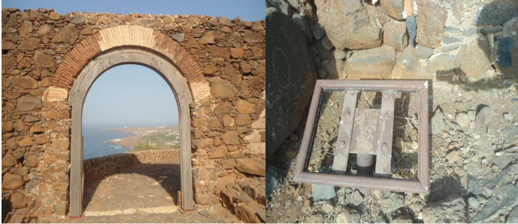
Fig.19 Imagem do “Porton Di Nós Ilha” (sem identificação e o mesmo acontece em todos os monumentos)