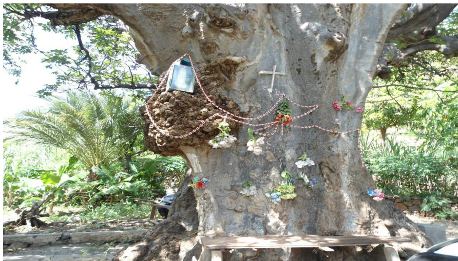
Fig.8 Pé de Calabaceira (Cabo Verde) ou Embondeiro (Angola) ou Baobá (Brasil). Existe registo de que o cientista Charles Darwing esteve em contato com a referida árvore