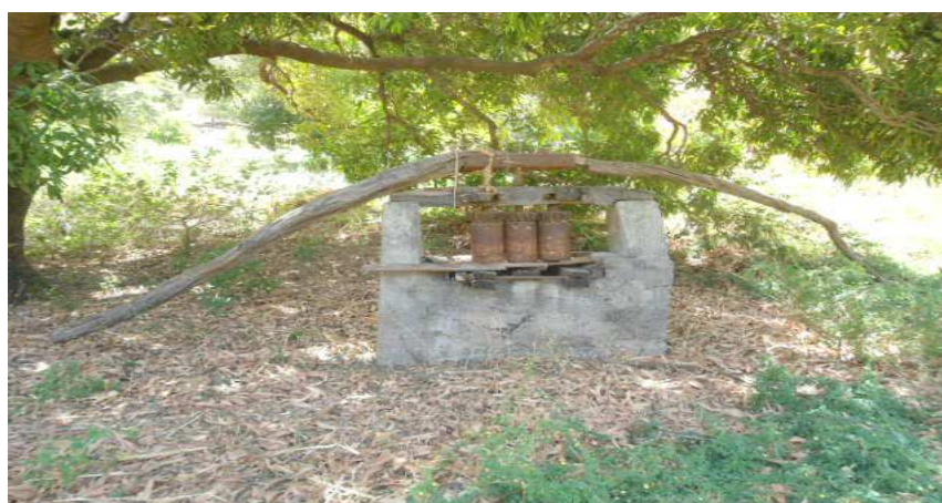
Fig.5 Trapiche tradicional, Ribeira Grande de Santiago