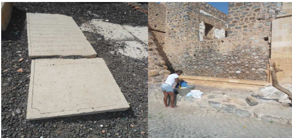
Fig.15 Interior da Sé Catedral