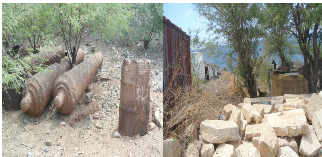
Fig.4 Interior do Forte de S. Veríssimo e o acesso entre o Forte S. Veríssimo e o escritório do IIPC