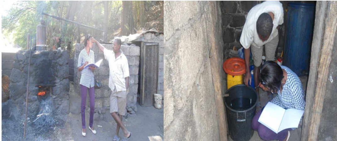
Fig.7 Dialogo com o produtor e verificação do grau do álcool no grogue.