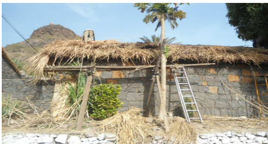
Fig.14 Reabilitação das casas na Rua Banana (cobertura de palha)