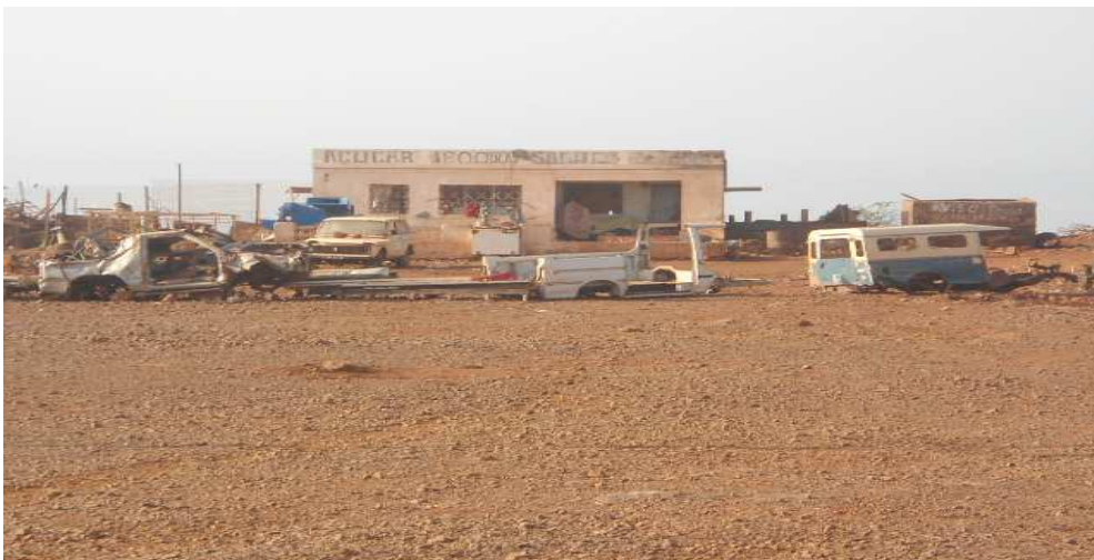
Fig.10 Depósito de carros inutilizados à entrada da Cidade Velha