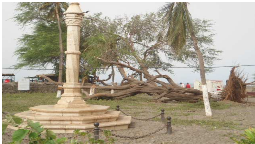
Fig.12 Após a forte ventania que se fez em Cidade Velha. Vista do Pelourinho ou “Picota”