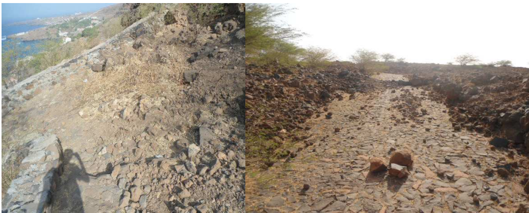
Fig.18 Acesso pedonal à Fortaleza Real de São Felipe (um dos monumentos mais visitado, preço 500$)