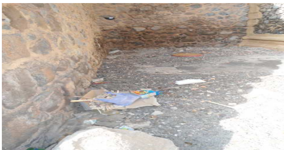
Fig.16 No interior das ruínas da Sé Catedral