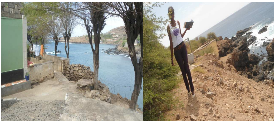
Fig.4 Entrada do Forte de S. Veríssimo (por dentro de uma habitação com 3 cães) e alternativa para o Forte S. Veríssimo (acesso perigoso)