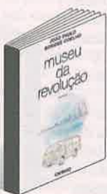
João Paulo Borges Coelho MUSEU DA REVOLUÇÃO Caminho, 488 pp, 21,90 euros

Pode ser, e sei que há um risco de o meu discurso ser confundido com conservadorismo. É preciso olhar com lucidez para o que se ganha e o que se perde. A literatura é um jogo de dar conta do que foi feito antes, é um exercício de cultura, com os seus códigos e regras, e uma tentativa de se inovar a partir do estranhamento, de um novo olhar lançado a realidades conhecidas. JL