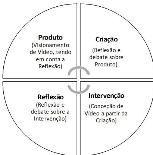
Figura 4 – Narrativas Fílmicas: Fases da estratégia de intervenção socioeducativa

De seguida, tendo em consideração a figura representativa de uma situação específica que se segue (Figura 4), iremos explicar como se processa a estratégia das narrativas fílmicas por meio das suas fases: produto ; criação ; intervenção ; e reflexão .