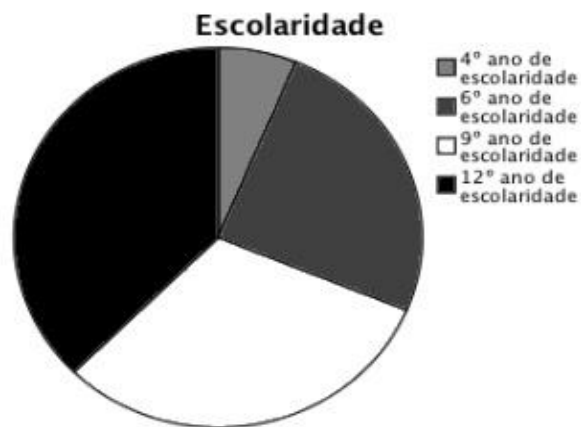
Figura 1 – Frequência de escolaridade do grupo