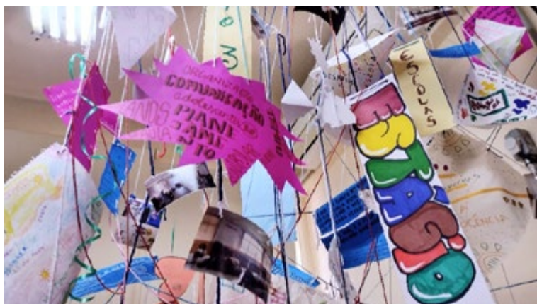
Figura 4 – Diário coletivo no final do semestre