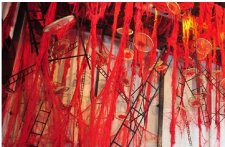
Figura 1 – Garimpo de si, de Adrianna Eu

vid-19, em 2020, trauma que impulsionou artistas, através de delírios e sonhos, a produzirem criações traçando linhas de escape diante da conjuntura que se impôs a todas e a todos nós.