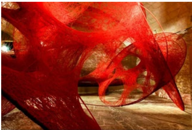
Figura 2 – Linhas da vida, de Chiharu Shiota

Banco do Brasil São Paulo (CCBB SP), em 2019, apresentando intervenções espaciais com emaranhados de linhas, inspirada em experiências e memórias pessoais e na transitoriedade cíclica da vida, assim convida o público a pensar sobre a vida, nossas memórias, propósitos e conexões.