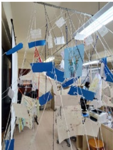
Figura 3 – Fragmento do diário coletivo nas primeiras semanas

O diário coletivo foi sendo gestado ao longo do semestre, às vezes na escola, às vezes durante a aula na universidade, em concomitância com a discussão de um texto e interrogados por nós enquanto grupo: o que essas imagens querem no/do texto? Se retiradas, farão falta? Estão compondo com o texto ou estão representando o texto? Houve um contínuo exercício de querer saber sobre essas imagens, de inquiri-las a como vieram a ocupar essas linhas do diário. A relação dessas imagens com o pensar parece inevitável. São imagens do pensamento ou pensamento sem imagens? Em que se difere uma imagem do pensamento, de um pensamento sem imagem?