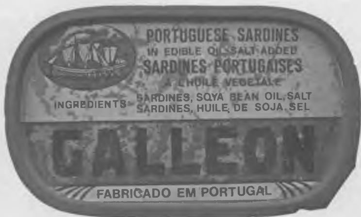
Galleon, consagrada marca de conservas de sardinha da fábrica Júdice Fialho de Portimão