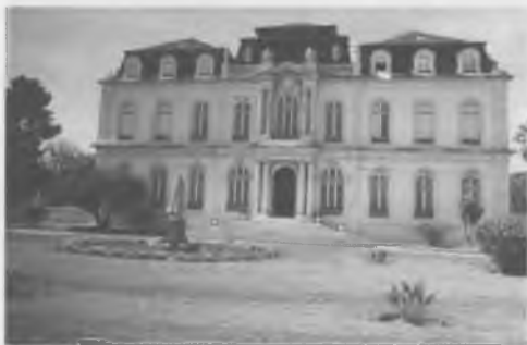
O antigo Palácio Fialho, hoje propriedade da Diocese do Algarve.

A sua prosperidade financeira permitiu-lhe construir na colina de Santo António do Alto, em Faro, uma magnífica residência ao estilo dos "châteaux" do Loire francês, que ficou conhecida, e ainda hoje se designa, como Palácio Fialho. Começou a construir-se em 1913, sob projeto do arquiteto Joaquim Manuel Norte Júnior, possui dois pisos e águas furtadas (ou sótão de caixão em pé alto), cujo eixo central se destaca do restante edifício. As suas características arquitetónicas evidenciam um forte revivalismo do estilo clássico francês. As obras concluí-