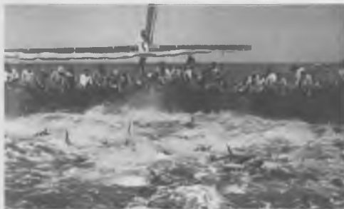
As companhas reunidas em armação na pesca do atum.

Impõe-se também salientar que as fábricas conserveiras da empresa Júdice Fialho foram as primeiras no país a possuírem creches para os filhos das operárias e salas de aleitamento para que as mães pudessem cuidar dos seus bebés durante as horas de trabalho. Também lhes eram prestados serviços médicos e apoio farmacêutico, além de ensinamentos de puerícia e aconselhamento no planeamento familiar. Em 17 de abril de 1916, a Câmara Municipal de