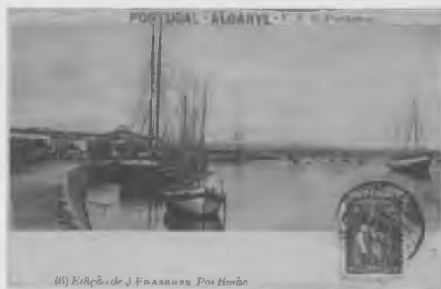
Postal de época mostrando o porto de Vila Nova de Portimão.

Face aos seus negócios e aos avultados meios de fortuna, Júdice Fialho passava largas temporadas no estrangeiro usufruindo da avançada cultura dos países do centro europeu, adquirindo conhecimentos nos mais diversos meios, quer científicos quer artísticos. A sua educação e es-