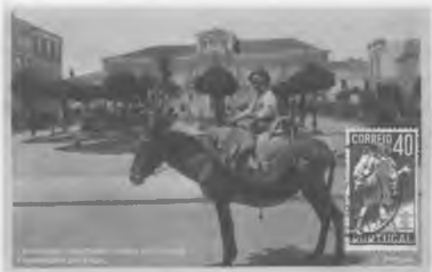
Postal retratando os típicos costumes da época: Praia da Rocha, Algarve, o vendedor de água.

geiros grandes lições, umas positivas quando baseadas na honra, outras negativas quando envasadas na corrupção. De todas soube sempre colher ensinamentos que lhe foram muito úteis no seu longo percurso empresarial. Muitas dessas falsas amizades usou-as em proveito próprio. Não obstante, foi um dos maiores industriais das pescas e da transformação conserveira no país, com fábricas no Algarve e noutras regiões do país, contribuindo com as suas iniciativas empresariais para o desenvolvimento da economia nacional.