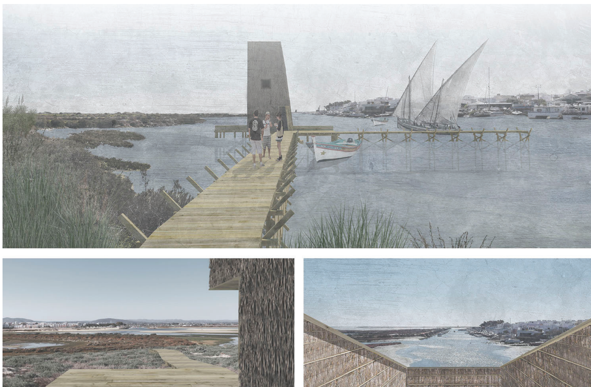
Fig. 8 Fotomontagens de projeto: cais mirante nas salinas (em cima) e vistas (em baixo)