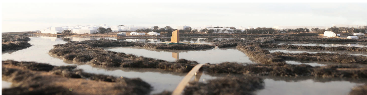
Fig. 4 Maqueta do cais mirante nas salinas (escala 1/500)