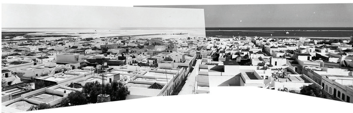
Fig. 6 Vista do topo da igreja, 1934 (em cima) e anos 1960 (em baixo)