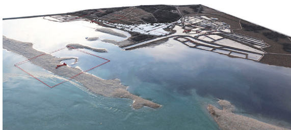
Fig. 9 Fuzeta no sistema lagunar da Ria Formosa, maqueta territorial (esc.1/2 000)

do ambiente marítimo, que nascem da metamorfose dos materiais do próprio lugar. Propõe-se trazer à luz do “luminoso sol algarvio”, uma nova forma de pensar e habitar o primitivo abrigo. Com forte simbolismo evocativo, estético e funcional, os novos abrigos tencionam proporcionar espaços de acolhimento e conforto, que convidam à meditação e fruição da “ria”.