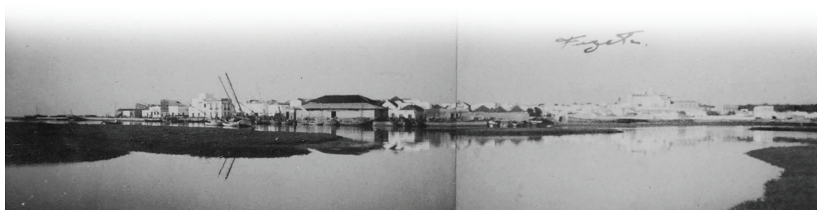
Fig. 1 Porto de Abrigo da Fuzeta, anos 1930