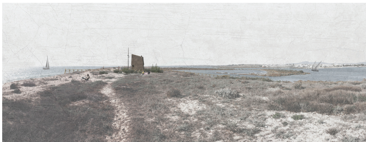
Fig. 7 Fotomontagem do cais mirante na ilha

Se o movimento implica uma acelerada experiência do espaço, o tempo da permanência – parar – contém em si a possibilidade da revelação do essencial, da disponibilidade para a reflexão, da ocasião para o encontro com o outro, da libertação do vulgar e do quotidiano. Despender tempo para deter-se no olhar, para questionar e compreender, para ganhar mais tempo e vislumbrar fixamente o horizonte, conferindo-lhe nitidez e profundidade.