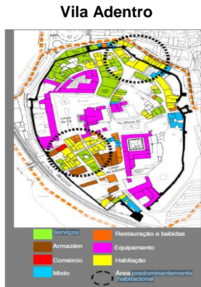
Figura 1- Delimitação da Vila Adentro

De acordo com a Câmara Municipal de Faro (2011), 75% dos imóveis localizados na ARU Vila Adentro encontram-se ocupados, 23% desocupados e 2% em processo de obras. A habitação representa 47% dos imóveis ocupados, 20% são estabelecimentos comerciais (reduzido a cafés), 19% são serviços públicos (autarquia e administração central), sendo que apenas 5% são equipamentos. A área habitacional encontra-se reduzida e concentrada em pequenos lotes, formando dois pequenos núcleos às “portas” das muralhas, como se pode verificar na Figura 1.