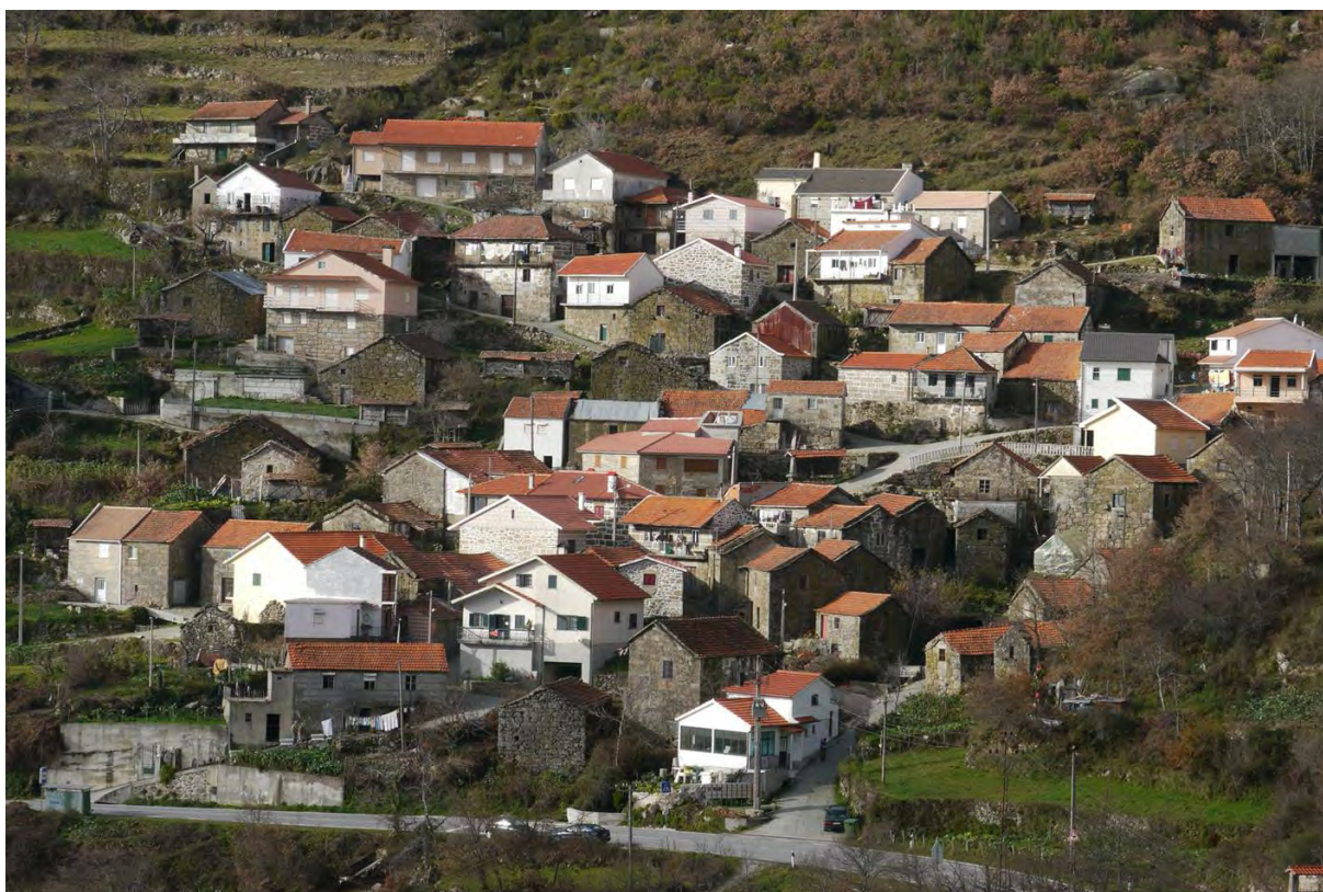
Figura 16 Carvalhosa, Montemuro; Elaborada pelo autor.

À parte este período excepcional de exploração do volfrâmio, também o maciço da Gralheira confirmará as regiões de montanha enquanto áreas da emigração para o país e para o estrangeiro. Uma das condições mais relevadas na caracterização do processo de transformação das áreas rurais do norte do país, no século passado, é justamente a presença da casa do emigrante. A partir de finais do século XIX, algumas das aldeias das regiões consideradas neste artigo, serão marcadas pelo aparecimento da casa do emigrante brasileiro de torna-viagem que frequentemente acrescentará uma dimensão mais eclética e exuberante à arquitetura do tabique a que anteriormente fizemos referência.