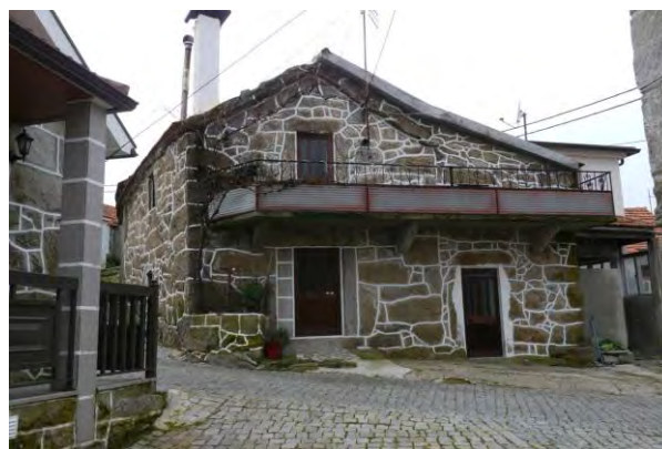
Figura 10 Gralheira, Montemuro; Elaborada pelo autor.