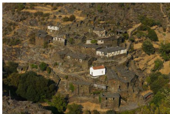
Figura 5 Drave, Arada; Elaborada pelo autor.