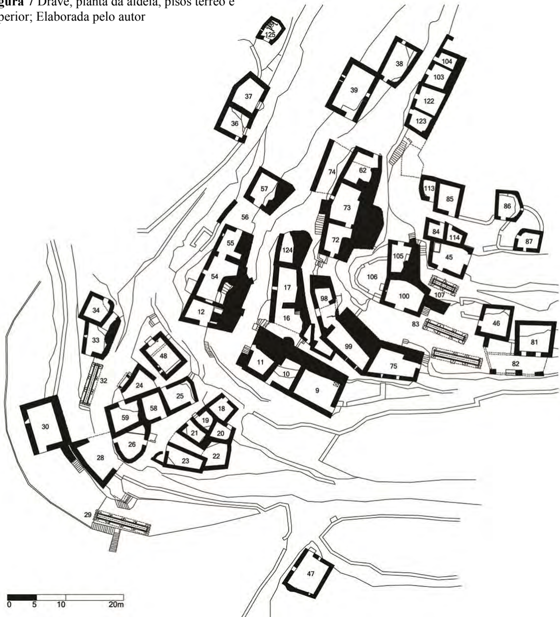
Figura 7 Drave, planta da aldeia, pisos térreo e superior; Elaborada pelo autor

duas casas, a partir do testemunho de antigos moradores. Na sua grande maioria, as leiras regadas dispunham-se em três bolsas principais, correspondendo a três regos distintos alimentados por poças encadeadas ao longo da ribeira a diferentes cotas (figura 6). Os processos de parcelamento, por herança, destas casas maiores enfatizaram progressivamente a importância das águas de partilha e da gestão comum de parte das estruturas construídas (que resultavam, por exemplo, nos trabalhos, entre consortes e herdeiros, de conservação dos regos e de reconstrução das poças).