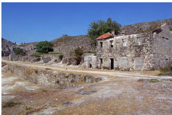
Figura 14 Minas de Regoufe, Freita; Elaborada pelo autor.