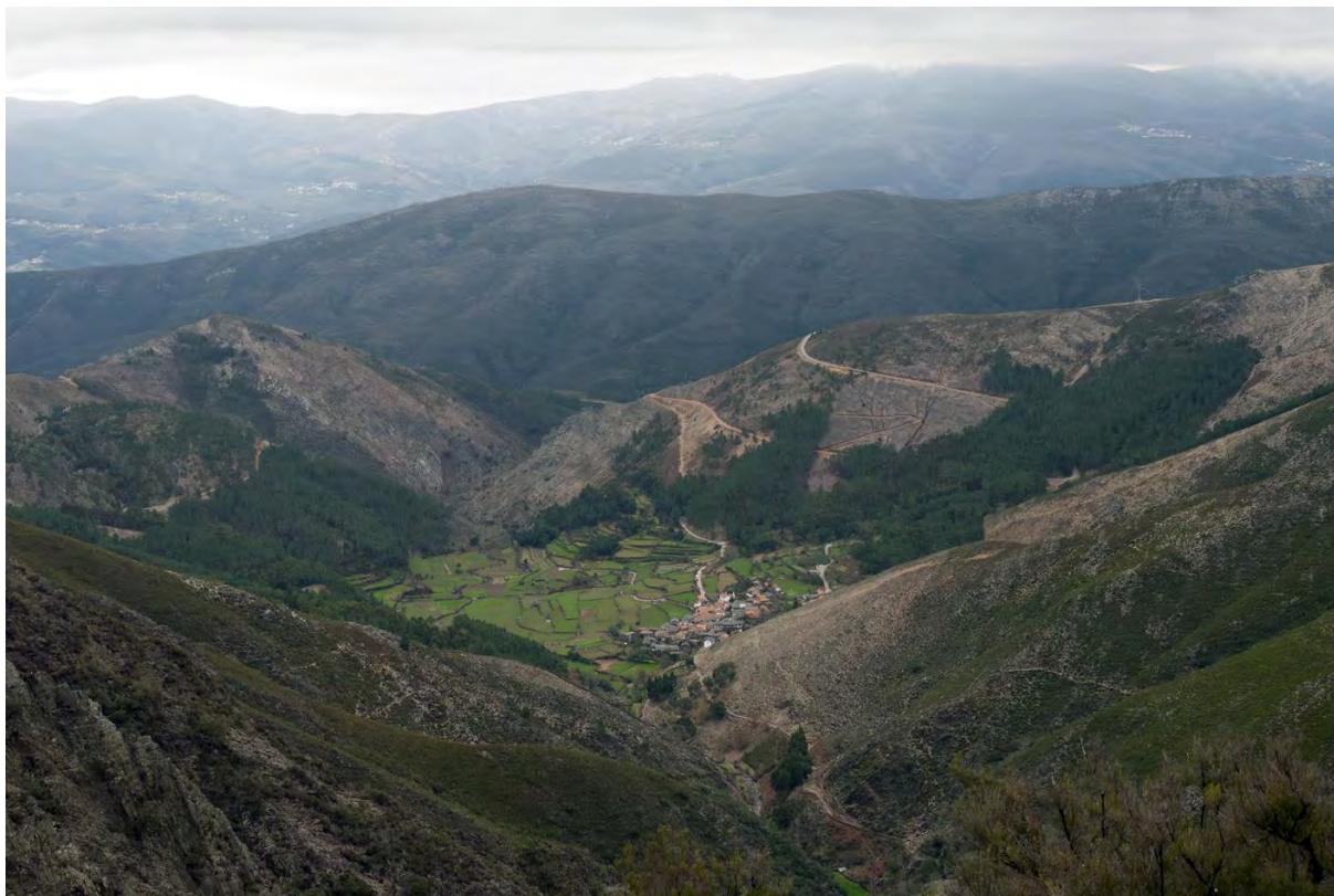
Figura 1 Covas do Monte, Arada; Elaborada pelo autor.

camas dos currais, às silhas de cortiços ou à produção de carvão. Vista do Portal do Inferno, a aldeia de Covas do Monte na serra da Arada, regista ainda hoje esta organização (figura 1), marcada como outras povoações pela persistência de muitos dos hábitos da economia tradicional, desde as culturas regadas ao rebanho aduado que ainda mantem.