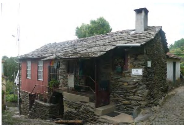
Figura 13 Parada de Ester, Montemuro; Elaborada pelo autor.