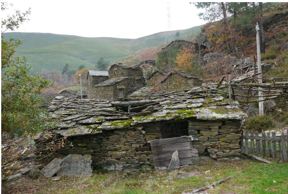
Figura 17 Levadas, Montemuro; Elaborada pelo autor.

Será, de resto, sobre alguns destes aglomerados que recairá a preferência para as novas formas de segunda habitação que marcam um outro tempo de transformação destas aldeias, a partir da década de noventa do século passado, registando uma alteração de discurso em relação à arquitetura vernacular, que se passa então a admirar. Mas na realidade, a formalização desse discurso restringir-se-á, quase sempre, a um desígnio de representação ou recriação da arquitetura local que, privilegiando a renovação à conservação, raramente traduzirá aquelas que são as suas características fundamentais, a nível da morfologia, da organização ou até dos sistemas construtivos tradicionais. Por outro lado, a ocupação sazonal destas lugares, em parte cada vez mais próximos das regiões urbanas do litoral, resultará na emancipação da aldeia em relação à paisagem, com o abandono ou a florestação das melhores terras da povoação de outrora.