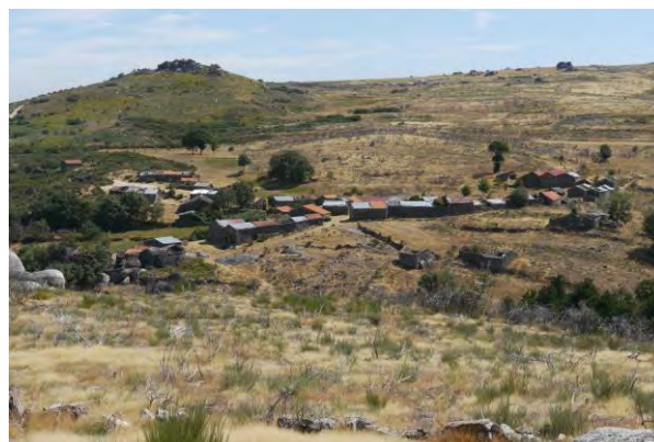
Figura 3 Mazes (núcleo da Anta), Montemuro; Elaborada pelo autor.