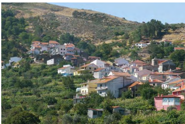
Figura 2 Mazes, Montemuro; Elaborada pelo autor.

Antes deste processo, a maior parte das famílias tinham as casas divididas nos dois lugares, com a aldeia de Mazes a corresponder à habitação matriz e a lojas várias e os lugares de cima a albergar o conjunto dos currais e palheiros associados frequentemente à habitação sazonal de um único compartimento (entre algumas raras habitações de ano inteiro). Isto porque, para além de ali se deslocarem duas vezes ao dia de modo a abrir e fechar as portas dos currais ao gado, a população de Mazes transumava para os lugares de cima, nos meses de estio (geralmente em Julho e Agosto). Recordando as brandas e inverneiras da serra da Peneda, o deslocamento estacional de Mazes é mais próximo do das aldeias da região de Soajo, (onde a inverneira, a cota mais baixa, constituía o núcleo principal), do que das de Castro Laboreiro (onde, ao contrário, eram as brandas mais altas que correspondiam aos períodos de maior permanência).