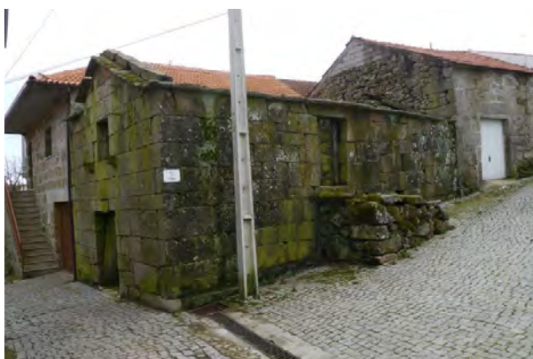
Figura 9 Covelo de Paivó, Freita; Elaborada pelo autor.