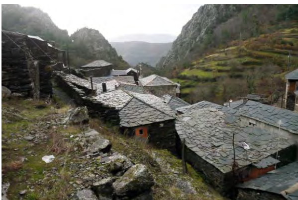
Figura 4 Pena, Arada; Elaborada pelo autor.