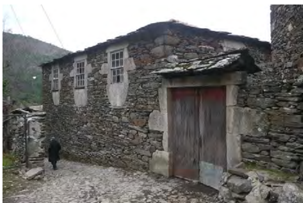
Figura 12 Covas do Monte, Arada; Elaborada pelo autor.

quilómetros, estas aldeias apresentam evidentes analogias na implantação na base de uma encosta voltada a sudeste na margem de um curso de água afluente do Paiva. Mas as dissemelhanças que se verificam a nível da orografia destes lugares – bem mais acidentado em Rio de Frades que em Regoufe – acabariam por contribuir para distinguir de sobremaneira os modelos dos assentamentos mineiros de Alemães e Ingleses. No primeiro caso, a nova povoação situada junto a um vale muito encaixado, dispersava-se em diferentes núcleos com acesso a partir da aldeia para sul: subindo para os bairros de Cima e da Capela situados respetivamente a meia encosta e em promontório; ou percorrendo o trajeto na margem da ribeira para as casas da Companhia e para as instalações técnicas, de armazenagem e da lavaria 9 .