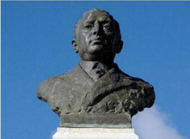
Busto - Sito no Largo de S. Francisco / Loulé