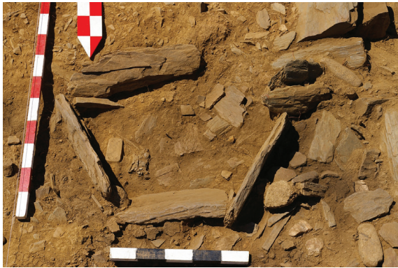
Fig. 7 Deposição no interior de uma pequena estrutura, localizada na Grande Estrutura Circular n.º 1