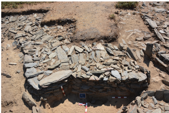
Fig. 5 Construção modular em Castanheiro do Vento. Parte do Bastião L e troço do murete 2

de muretes e bastiões (fig. 5). Porém, há também um conjunto de pormenores construtivos que remetem para um desvio à homogeneidade: a utilização específica de materiais em determinadas estruturas, como a utilização de tipos específicos de rochas em determinadas estruturas (fig. 6); e a utilização de materiais/fragmentos de materiais em deposições estruturadas, como veremos mais à frente a propósito das deposições. Este saber-fazer arquitetura remete-nos para atos construtivos ou ações de conformação do sítio inseridas num processo contínuo de vivências no local. Neste fazer arquitetura incluímos o gesto técnico e as técnicas de configuração enquanto noções operatórias que parecem funcionar dentro de uma matriz social e relacional das comunidades que foram fazendo Castanheiro do Vento. O ato de elaborar/configurar/manter um espaço torna-se uma atividade recorrente no tempo e no espaço do sítio, constituindo-se como um processo de entrelaçamento das dinâmicas sociais daquelas comunidades. O importante não terá sido construir, mas sim os processos de construção, alteração, manutenção do sítio, enquanto processo de habitação de um lugar e do mundo (Cardoso, 2010).