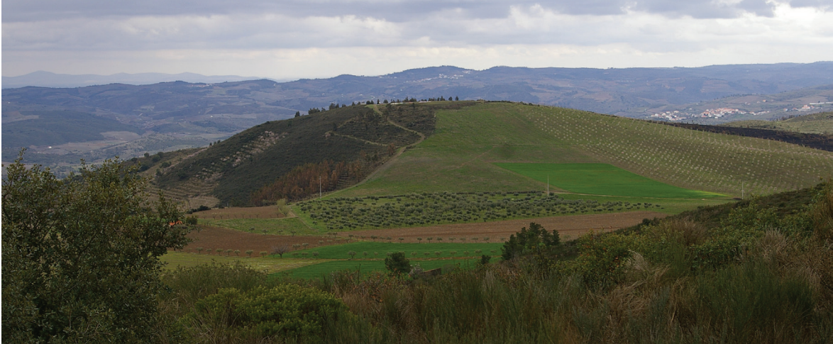
Fig. 3 Vista geral da colina onde se localiza Castanheiro do Vento