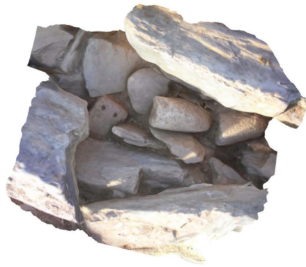
Fig. 8 Deposição de um fragmento de um peso de tear e de um fragmento de um movente em granito no interior do murete 1

de afloramentos rochosos para a produção do aparelho construtivo associam-se outros contributos de formas de fragmentação. A construção do murete é, deste modo, um acumulado organizado e com sentido de elementos díspares, um acumulado de elementos onde se congregam igualmente um conjunto de gestos anteriores. Um murete é, deste modo, um acumulado de gestos e deposições entre os quais se faz a emergência do dispositivo arquitetónico.