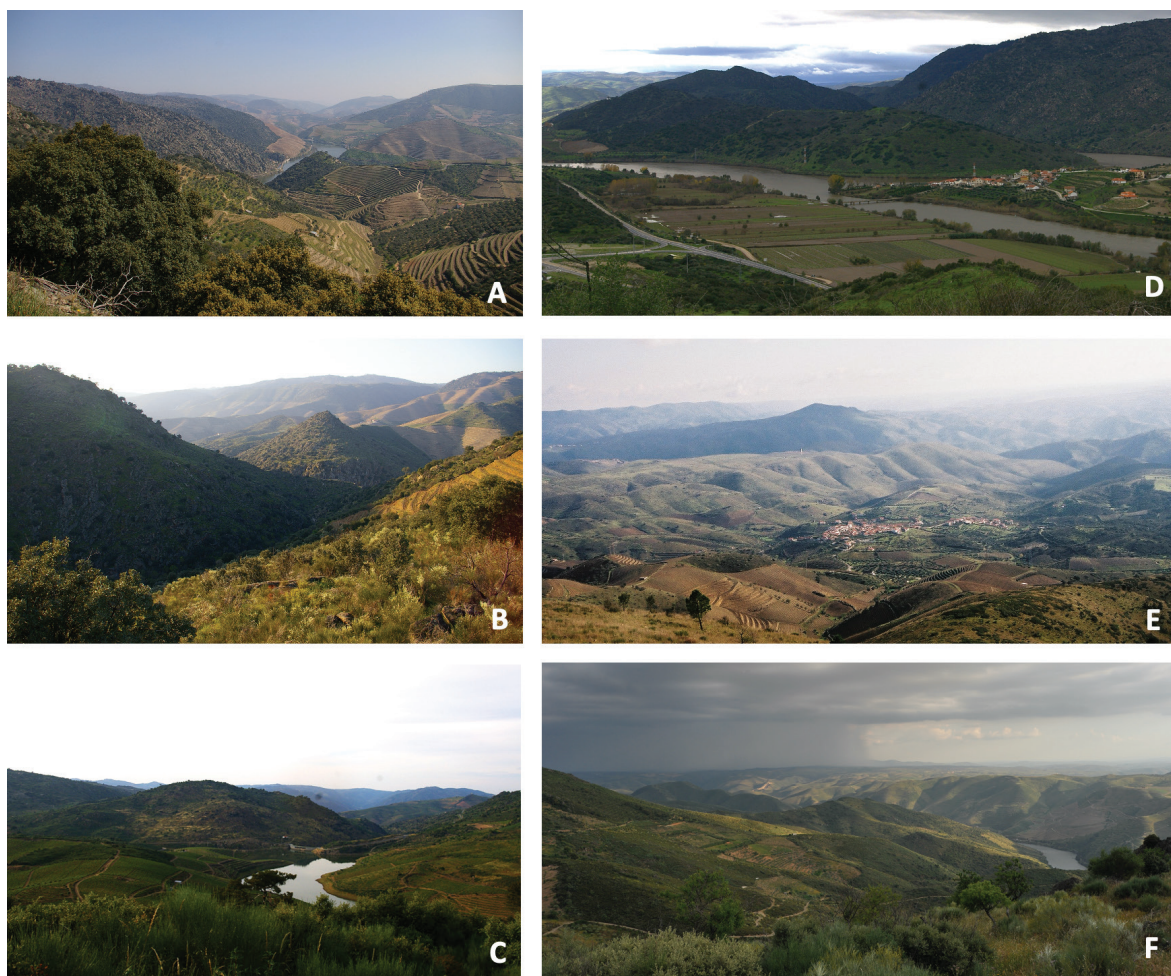
Fig. 2 Paisagens visíveis de vários recintos

A Quinta da Abelheira B Pitanceira C Zaralhôa D Quinta de Alfarella E Castelo Velho de Freixo de Numão F Nossa Senhora de Urros