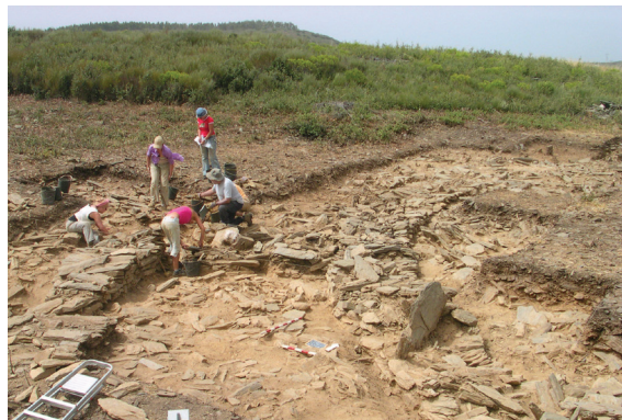
Fig. 6 Pormenores construtivos. Grande laje de xisto disposta ao alto

Compreender a arquitetura do Castanheiro do Vento como prática, e não como um conjunto de edificações sucessivas, exige também pensar o modo como teriam participado os outros elementos que concorrem na vida das comunidades. Os recipientes cerâmicos, a indústria lítica e a fauna, por exemplo, são elementos que aparecem recorrentemente em Castanheiro do Vento,