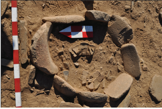
Fig. 9 Estrutura delimitada por fragmentos de dormentes em granito, no interior da qual se encontravam partes de distintos recipientes cerâmicos

a convicção que em todos os lugares corre um fio invisível que liga um ser vivo a outro por um instante e a seguir se desfaz, e depois torna a estender-se entre pontos em movimento desenhando novas rápidas figuras de modo que a cada segundo a cidade infeliz contém uma cidade feliz que nem sequer sabe que existe (Calvino, 2000, p. 151); são topografias in-finitas de uma arquitetura que interpela o processo de estudo, desafiando a novas questões.