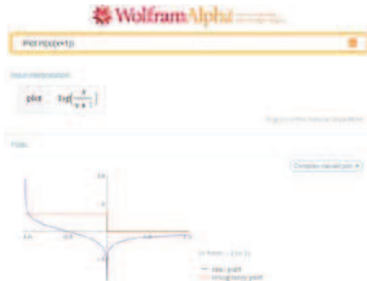
Figura 7: Exemplo de utilização do Wolfram | Alpha para representação gráfica de funções

Adicionalmente, esta experiência pedagógica motivou a adaptação de alguns dos elementos de avaliação, permitindo a inclusão de questões com carácter mais conceptual e desviando um pouco o foco da mera aplicação mecânica de fórmulas e do simples cálculo numérico (para uma geração dependente da máquina de calcular).