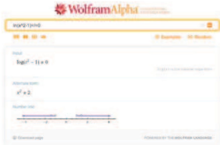
Figura 6: Comentário de um aluno que não assistiu à aula onde foi explicado como representar \neq no Wolfram | Alpha

Comentário: Olfon foi um castigo para colocar o sinal de " \neq ".