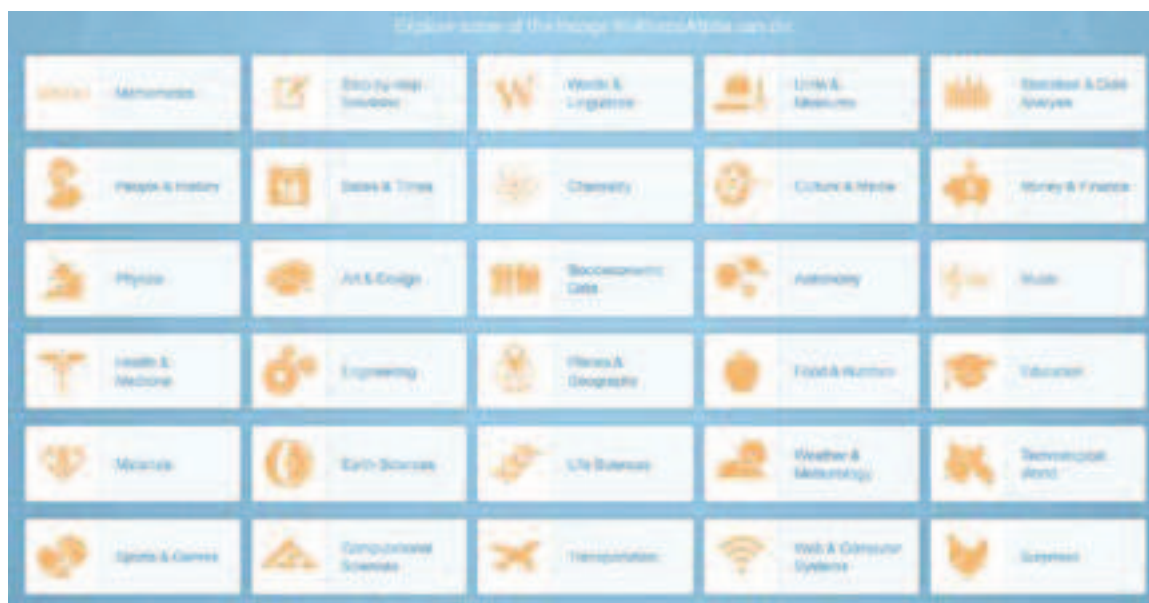
Figura 2: Imagem ilustrativa de diversos tópicos que podem ser explorados através do motor de conhecimento computacional Wolfram | Alpha